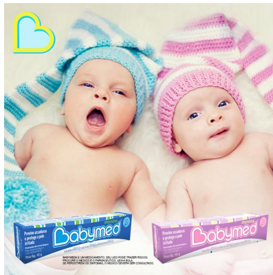
Figura 2 – Imagem publicitária (pomada para bebês)

Diferentemente das imagens da fotografia, as imagens da publicidade possuem o objetivo de seduzir certo público ao consumo, à obtenção de produtos (Figura 2).