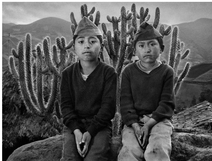
Figura 1 – Fotografia da série “outras Américas” – Equador, 1982