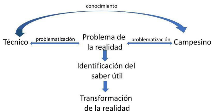
Figura 1: Problematización de la realidad mediante el diálogo de saberes.