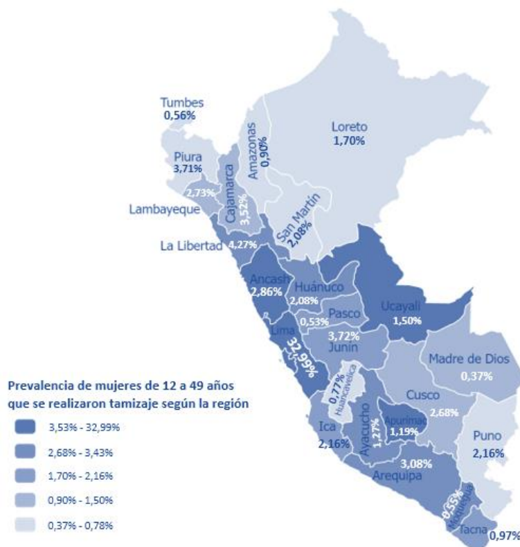
FIGURA 2. PREVALENCIA DE MUJERES DE ENTRE 12 Y 49 AÑOS QUE SE REALIZARON TAMIZAJE SEGÚN LA REGIÓN (N=11 597).

En la regresión múltiple, cada factor analizado se ajustó con todas las demás covariables confusoras. Se observó que las mujeres con edades de 37 a 49 años tuvieron 139 % menor frecuencia de haberse realizado alguna prueba de tamizaje, en comparación a quienes tenían edades de 12 a 28 años (RP=2,39, IC95 %: 2,25 – 2,53). De la misma manera las mujeres con pareja tuvieron 61 mayor frecuencia (RP=1,61, IC95 %: 1,52 – 1,71); las mujeres con un estado socioeconómico pobre tuvieron 9 % mayor frecuencia (RP=1,09, IC95 %: