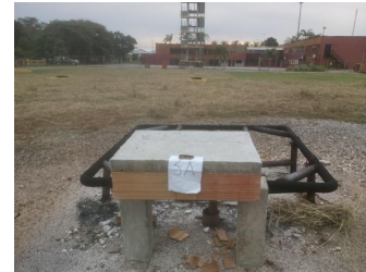
Figura 3: Colocación de modelos en simulador de incendio.

alimentado por gas metano. Una vez separada cada franja de losa, se procedió a colocarla sobre apoyos de concreto, simulando un elemento simplemente apoyado, colocado a un lateral del simulador, cerca de la boca de salida del gas, como se muestra en la Figura 3.