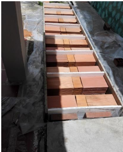
Figura 2: Construcción de modelos de losas.

Central del Cuerpo de Bomberos de Valencia. El ensayo consistió en la exposición de los modelos de losa a fuego directo fuego, por un lapso de tiempo de 60 minutos para cada ensayo, este tiempo fue seleccionado de acuerdo a lo establecido en el documento Seguridad frente al fuego de estructuras de hormigón de Vega y Buron [4]. De acuerdo a estos autores, para 60 minutos la temperatura alcanzada para un recubrimiento de 3 cms se estima en 370°C, mientras que para temperaturas de 400°C se estima en 15 % la pérdida de resistencia del acero de refuerzo.