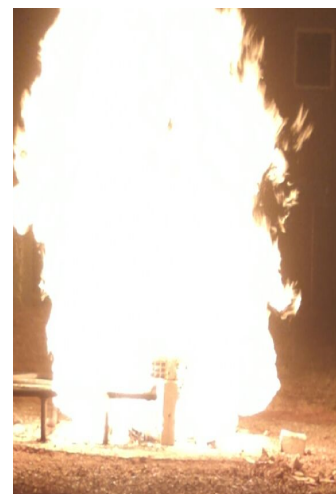
Figura 4: Ensayo de exposición al fuego de losas.

Se utilizó una presión de treinta (30) psi, para luego inducir la llama haciendo uso de una chispa externa, (Ver Figura 4), posterior al momento de que la llama actuara de forma envolvente sobre la probeta se registró el tiempo establecido mediante la utilización de un cronómetro. Por otro lado para estimar la temperatura alcanzada por el elemento, se utilizó un termómetro digital de láser, midiendo temperatura en el concreto antes e inmediatamente después de los 60 minutos de exposición.