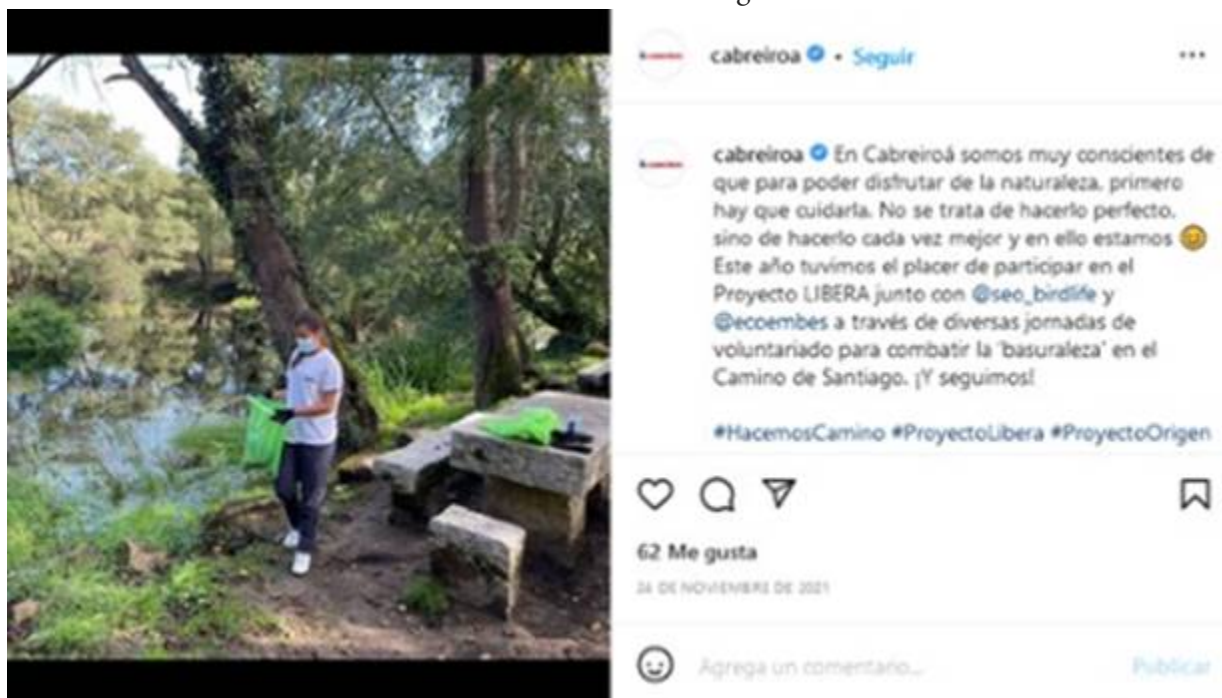
Ilustración 4 Publicación de Cabreiroá del 24/11/21 en Instagram @cabreiroa

En todos los casos, destaca que los temas se tratan principalmente, a través de publicaciones de imagen, si bien cabe subrayar el caso de los envases, en los que hay un total de 17 publicaciones de vídeo con este contenido, una cifra muy por encima de cualquier otra temática tratada con este tipo de publicación.