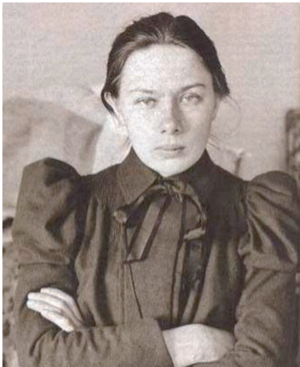
Foto de Nadezhda Konstantinovna Krupskaya na juventude.