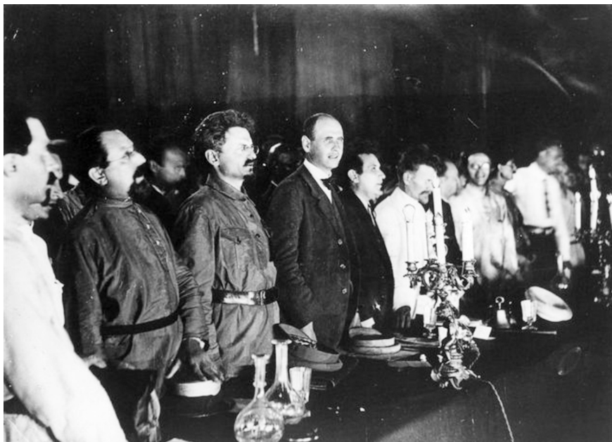
Segundo Congresso da Internacional Comunista (Trotsky é o terceiro da esquerda, ao lado de Paul Levi e Zinoviev), realizado em Moscou e Petrogrado, de 19 de julho a 6 de agosto de 1920.