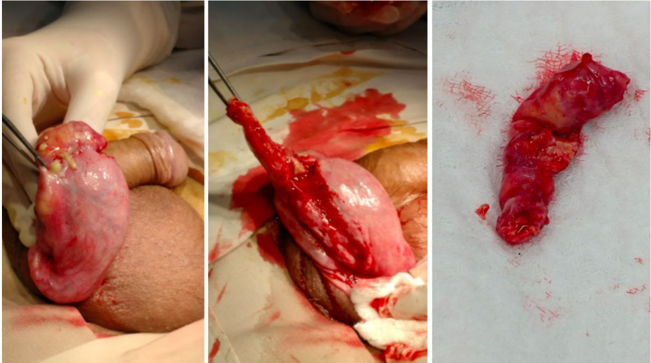
Figura 1. Hallazgos intraoperatorios de hidrocelectomía y epididimectomía derecha. Epidídimo derecho engrosado y caliente al tacto, que se punciona y drena material caseoso y purulento. Testículo derecho indurado sin áreas evidentes de secreción.

tejido por Mycobacterium tuberculosis . Se inicia manejo tetraconjugado (Pirazinamida 1600 mg/día vía oral + Etambutol 1100 mg/día vía oral + Isoniacida 300 mg/día vía oral + Rifampicina 600 mg/día vía oral) asociado a Piridoxina 50 mg /día vía oral, por tuberculosis miliar, pulmonar y genitourinaria. Se decide solicitar ecografía de vías urinarias por la sospecha de TBCGU, evidenciando hallazgos sugestivos de dilatación pielocalicial bilateral, por lo que se solicita urografía excretora para descartar compromiso ureteral. Se evidencia retardo en la eliminación del medio de contraste bilateral asociado a dilatación ureteral bilateral de predominio derecho ( Figura 2 ). Con estos hallazgos sugestivos de TBCGU, se realiza pielografía retrógrada bilateral ( Figura 3 ), y por sus hallazgos se decide derivar al paciente con catéter JJ bilateral por compromiso ureteral de TBC con el fin de aliviar la dilatación pielocalicial previamente referida y evitar la progresión a falla renal. El paciente es dado de alta por infectología y urología. En el momento se encuentra asintomático con adecuados niveles de azoados.