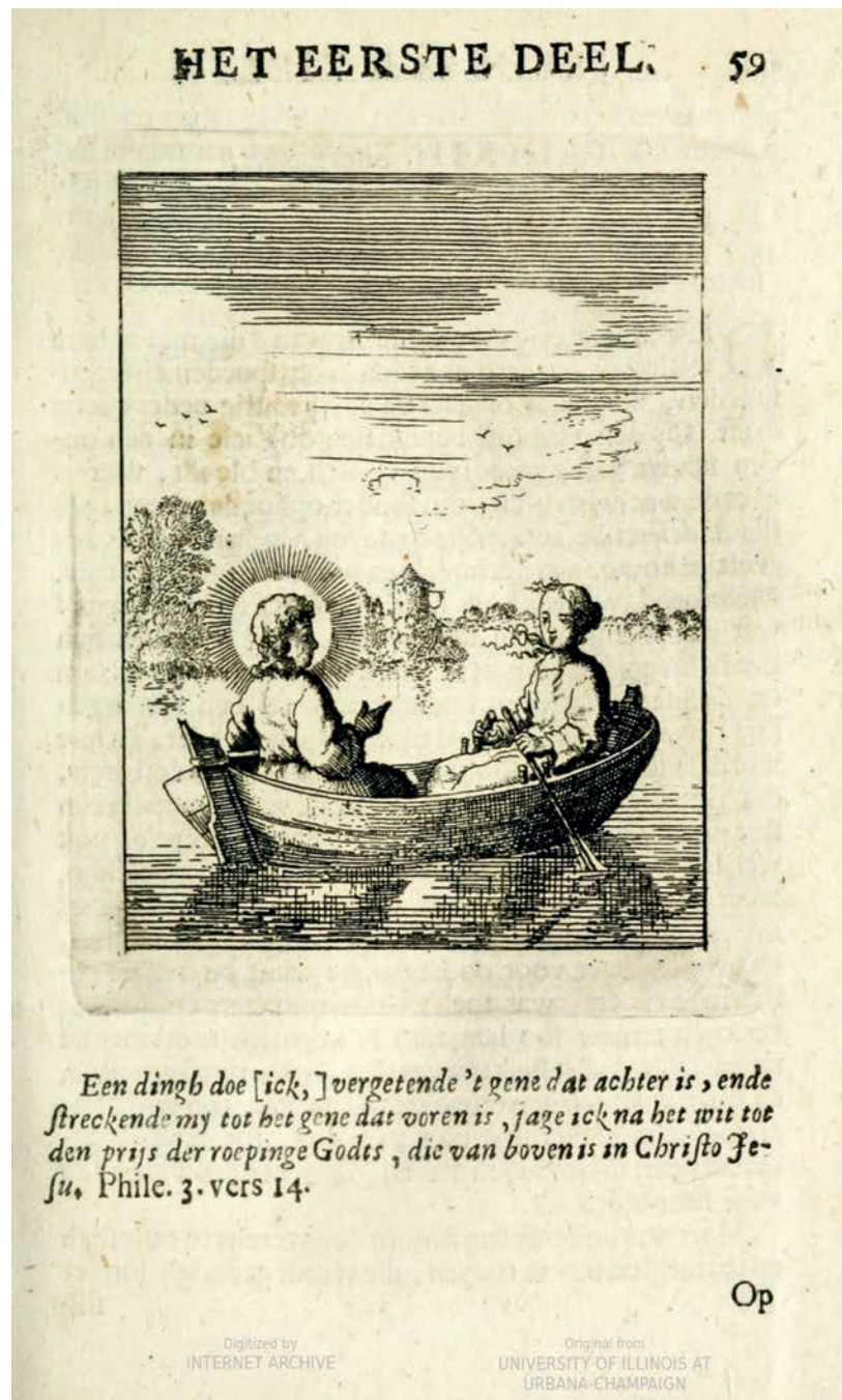
Figura 5. Jan Luyken, Grabado del Emblema XIII de Jesus en de Ziel: Een Geestelycke Spiegel voor 't Gemoed , 1696 [1678], grabado, Universidad de Illinois en Urbana-Champaign. Imagen obtenida de Hathi Trust Digital Library. Imagen de dominio público. Disponible en https://babel.hathitrust.org/cgi/pt?id=uiuo.ark:/13960/t1kh16q8n&view=1up&seq=67&skin=2021 .