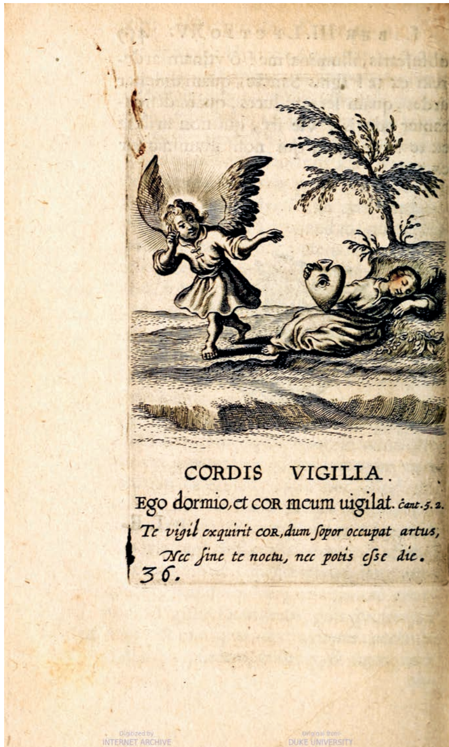
Figura 2. Boetius Adamsz Bolswert, Grabado del Emblema XXXVI de Schola Cordis , 1635 [1629] grabado, Universidad Duke, Durham. Imagen obtenida de Hathi Trust Digital Library. Imagen de dominio público. Disponible en https://babel.hathitrust.org/cgi/pt?id=dul1.ark:/13960/t0ft9r685&view=1up&seq=498&skin=2021 .