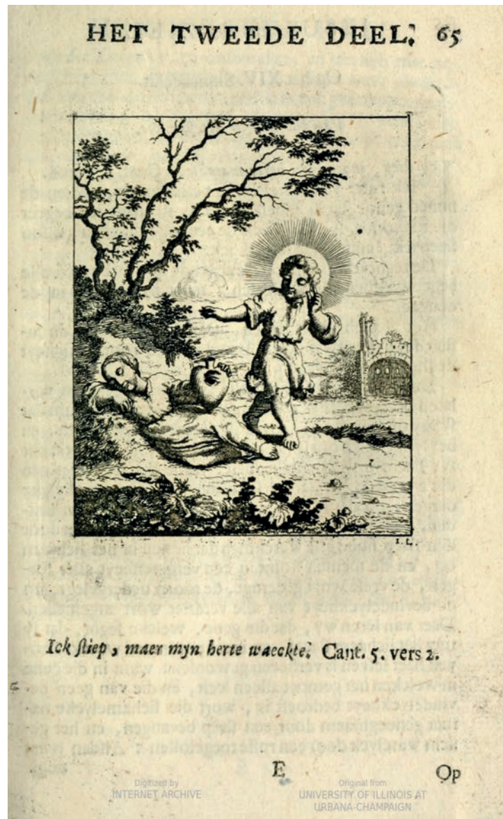
Figura 1. Jan Luyken, Grabado del Emblema XIV de Jesus en de Ziel: Een Geestelycke Spiegel voor 't Gemoed , 1696 [1678], 3 grabado, Universidad de Illinois en Urbana-Champaign.