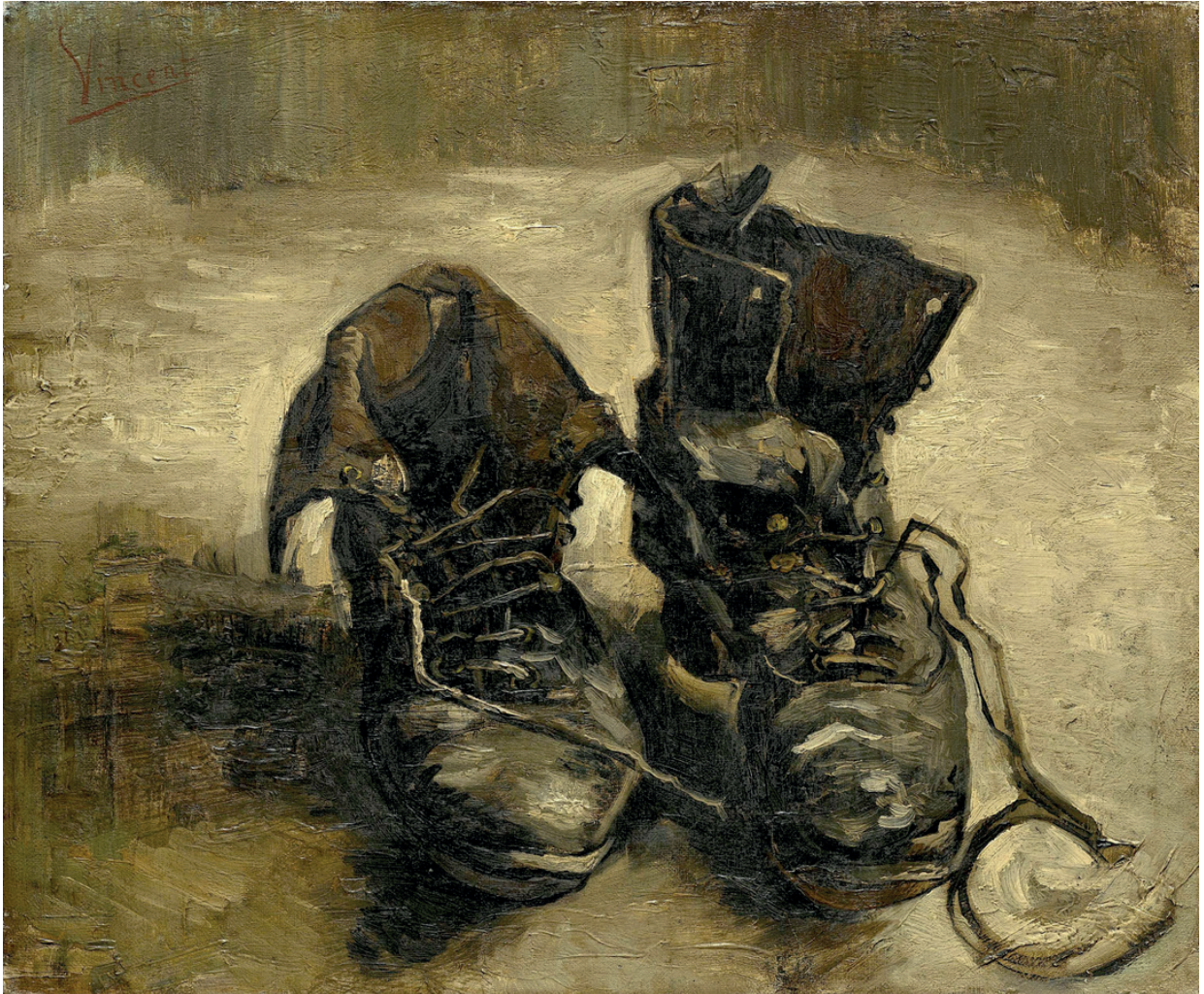
Figura 1. Vincent van Gogh, Zapatos , 1886, óleo sobre lienzo, 38.1 x 45.3 cm, Museo Van Gogh, Ámsterdam, dominio público. Disponible en https://historia-arte.com/obras/zapatos- viejos (consultado el 30 de agosto de 2021).