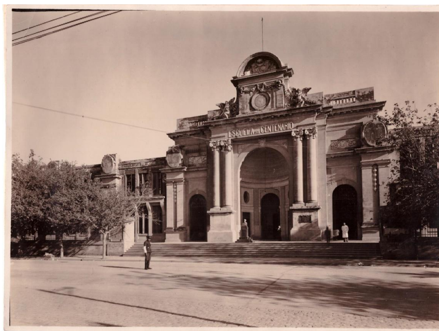
Figura 1. Escuela del Centenario.

El presente artículo pretende desandar desde el análisis del discurso algunas categorías teóricas propuestas por el entonces gobernador de Santiago del Estero, Antenor Álvarez, en ocasión de dejar inaugurado el edificio de la Escuela del Centenario y la Biblioteca del Estado en 1916 (la Biblioteca 9 de Julio fue creada mediante ley n°500 del 28 de junio de 1915, inaugurada en octubre del siguiente año). En principio, recuperar estos discursos como fuente documental, para luego generar un análisis de los mismos desde un enfoque histórico nos permitió recuperar las impresiones del pasado nacional enunciadas por uno de los intelectuales provinciales de este período, y en otro sentido, las de un sujeto histórico en un rol político.