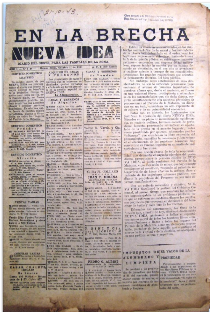
Figura 1. Portada del número inaugural del periódico Nueva Idea , 1 de octubre de 1943.

los gobiernos municipales. Aquí se revela el periódico como actor político con la misión de influir en la toma de decisiones políticas de las autoridades comunales (véase figura 1).