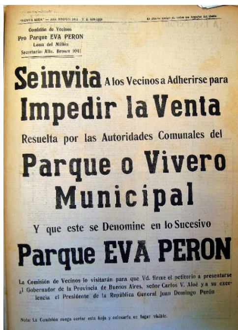
Figura 6. Afiche convocando a impedir la venta del parque. Nueva Idea, 30 de octubre de 1952

Esta comisión de vecinos cree que aceptar esa tesis sería olvidar los principios del peronismo, porque al observar lo que se piensa construir, vemos que no queda lugar para parque donde instalar los juegos infantiles. (Al margen de una reunión realizada en el Concejo Deliberante de Matanza, 1952).