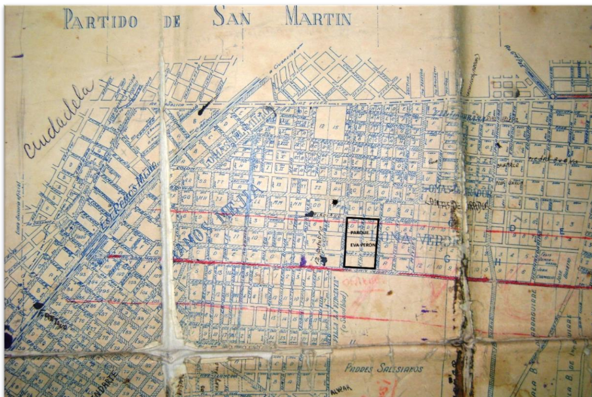
Figura 5. Plano con la ubicación del proyectado parque Eva Perón. El recuadro negro marca los límites del parque Eva Perón. Arriba a la izquierda de este, el punto negro indica la ubicación de los talleres gráficos de Nueva Idea .

En la figura 5 se puede observar la ubicación del proyectado parque Eva Perón.