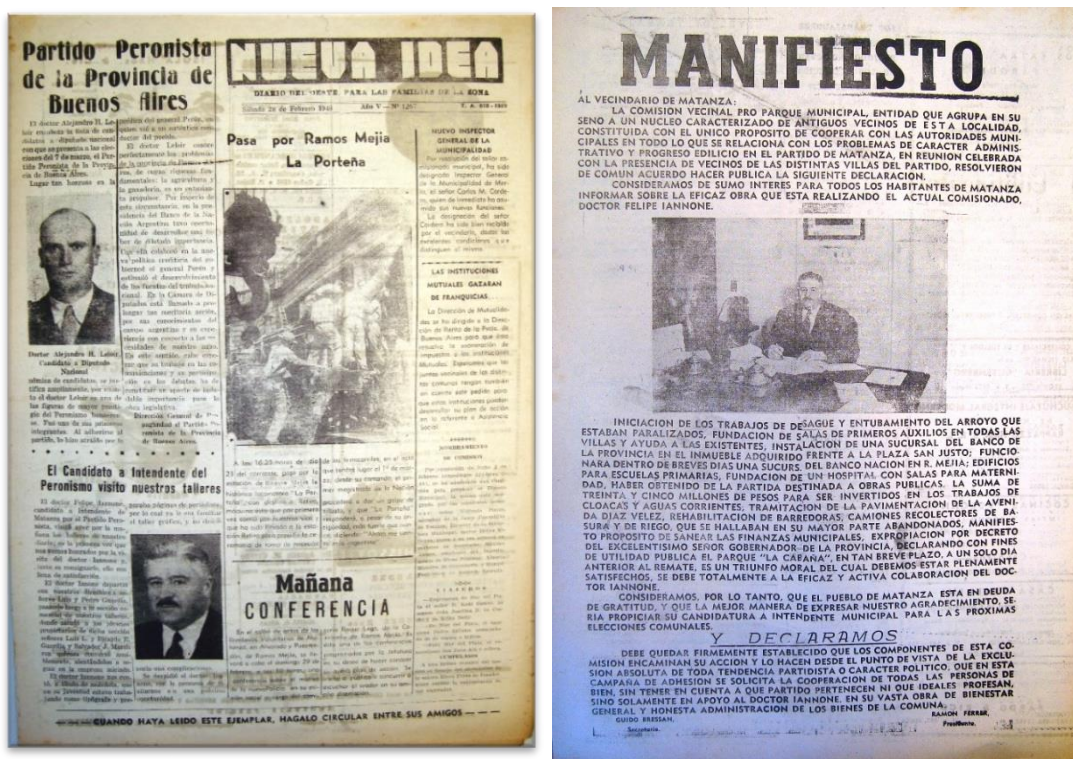
Figura 2. En los ejemplares anteriores se observan ejemplos de la participación del diario en la campaña electoral.

Bajo la figura 2, en la imagen de la izquierda, en el ángulo inferior izquierdo la nota habla del Dr. Iannone, candidato peronista, visitando las instalaciones del periódico, este hecho determinaba en cierto modo la influencia del Nueva Idea en la política local, al merecer el diario la visita del candidato. En la imagen de la derecha manifiesto que apoyaba la candidatura de Iannone. Al final, declaraban que el llamamiento incluía a simpatizantes de cualquier fuerza política que quieran apoyar la obra del Dr. Iannone como comisionado.