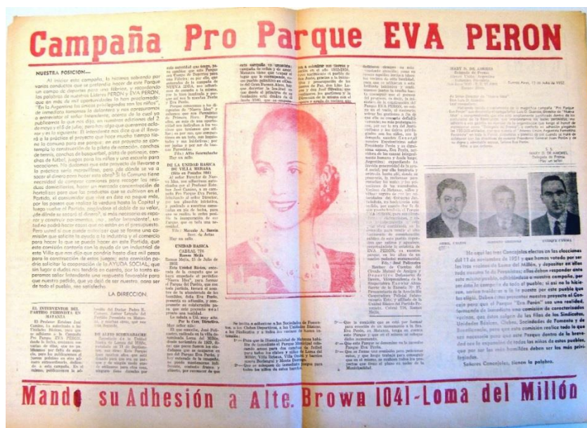
Figura 4. Página central promocionando la creación del parque Eva Perón. Nueva Idea , 17 de julio de 1952.