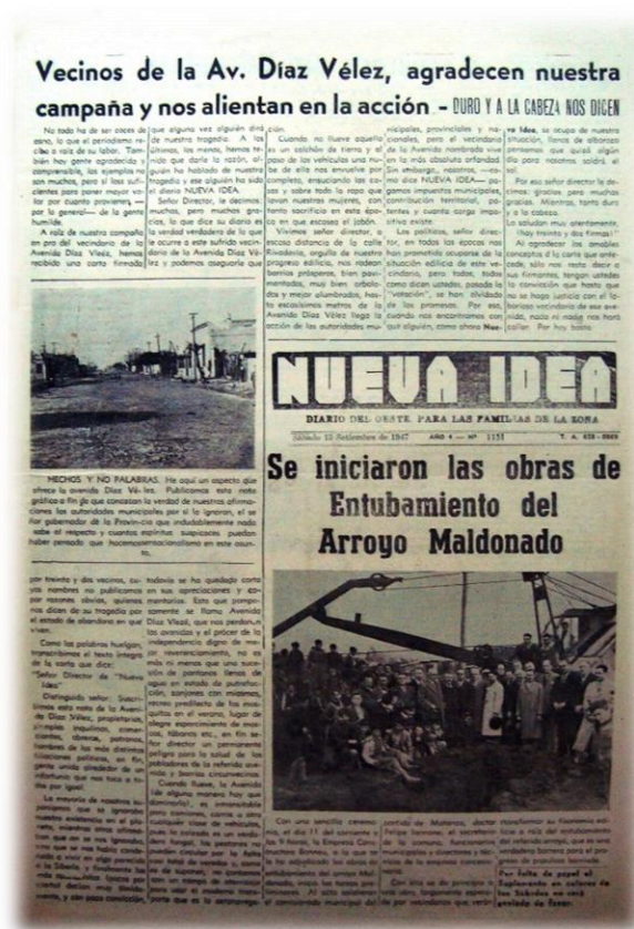
Figura 3. Se observan en esta portada las referencias a las obras mencionadas de pavimentación de la Av. Díaz Vélez y entubamiento del arroyo Maldonado. Portada de Nueva Idea , 13 de septiembre de 1947.

Durante esta época, Nueva Idea continuó bregando por la realización de obras de mejora urbanística y de salubridad, haciendo suyos los reclamos del vecindario, entre las que se destacaron la pavimentación de la Av. Díaz Vélez y el entubamiento de la sección matancera del arroyo Maldonado (figura 3).