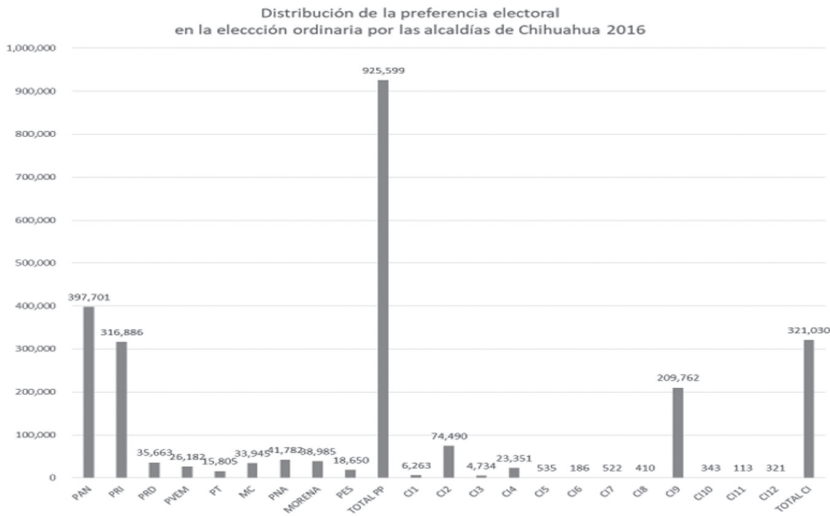
Gráfica 3: Distribución de la preferencia electoral y Elección ordinaria por las alcaldías de Chihuahua 2016