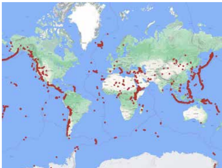
Figura 1: Volcanes activos (puntos rojos) alrededor del mundo. Las líneas rojas son los límites de las placas tectónicas y es donde se concentran las anomalías de calor y la mayoría de los volcanes.

años 1998 y 2017, a nivel mundial las actividades volcánicas y los incendios forestales afectaron alrededor de 6 millones de personas y causaron 2400 muertes [3].