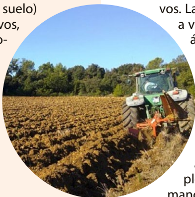
Figura 2. Presencia de jales mineros aledaños a suelos agrícolas en la comunidad de San Felipe de Jesús, Sonora.

y la plata (Ag). Estos desechos contienen MP en el orden de miligramos por cada kilogramo y constituyen partículas finas (algunas de alrededor de 2.5 micras), que pueden dispersarse fácilmente al medio circundante por acción del viento o del agua. De hecho, un escenario común es la presencia de jales mineros aledaños a suelos agrícolas ya que ambos se suelen encontrar en las cercanías de los ríos y arroyos en donde los jales mineros, en la mayoría de los casos, constituyen pilas de toneladas de material (figura 2). Cuando los MP llegan a los suelos agrícolas desde los jales mineros se producen procesos de meteorización (como aquellos que dan origen a la formación del suelo) y se pueden integrar al suelo y a los cultivos, deteriorando por un lado los suelos agrícolas y por el otro representando un riesgo a la salud para los consumidores de los cultivos contaminados.