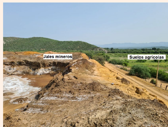
Figura 3. Esquema de algunos métodos de tratamiento de suelos mediante proceso fisicoquímicos. Elaboración propia: Luis Antonio Loyde de la Cruz [9].

La desorción térmica aprovecha que algunos MP y sus compuestos son volátiles a ciertas temperaturas, por ejemplo, el Hg. Para esto se utiliza vapor, microondas o radiación infrarroja; donde los suelos se calientan por encima de 300 °C (aunque esta técnica en particular es más efectiva para volatilizar contaminantes orgánicos). Si se emplean, por ejemplo, temperaturas por encima de 1600 °C, la materia orgánica del suelo es eliminada y la masa que se forma, después de que el suelo se enfría, forma rocas vítreas en las que los contaminantes quedan atrapados (inmovilizados); posteriormente estas rocas vítreas pueden emplearse, como materiales de construcción. Otras metodologías más sofisticadas incluyen la aplicación de un gradiente de potencial eléctrico (una diferencia de corriente), empleando electrodos que se insertan en el suelo. Esto provoca que los iones metálicos (cargados positiva o negativamente) migren desde los suelos a los electrodos y los recubran, como cuando se croman objetos. Esta técnica además de remover los MP también permite recuperarlos [9] (Figura 3).