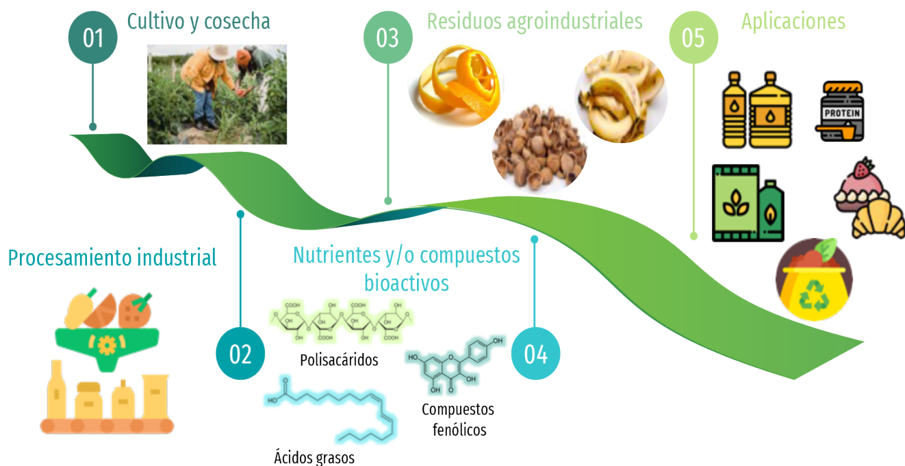
Figura 1. Ruta de la generación de residuos agroindustriales y aplicaciones potenciales.

Una de las estrategias para aprovechar los RAI es su incorporación a la línea de producción o usarlos en una segunda cadena de producción. Dentro de las posibles alternativas de su uso se encuentran la obtención de compuestos bioactivos o nutrientes, los cuales se pueden utilizar como ingredientes para la formulación de alimentos funcionales y nutraceuticos o con funcionalidad tecnológica (figura 1), además de otras opciones como fuentes de proteína alternativa, generación de energía, aplicaciones en industria farmacéutica y cosmética [7], [8].