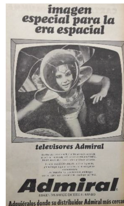
Figura 8 Anuncio de televisores Admiral , 1969