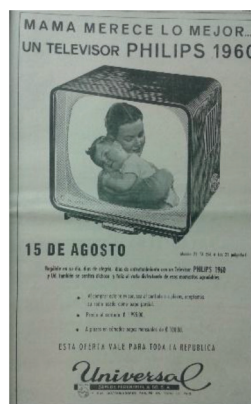
Figura 18 Anuncio de televisores Philips , 1960