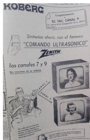
Figura 4 Anuncio de televisores Zenith , 1962

Fuente: La Nación , 27 de febrero de 1962: 9.