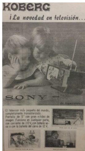
Figura 5 Anuncio de televisores Sony , 1964