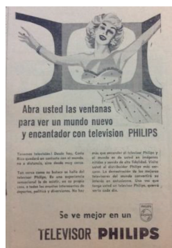
Figura 1 Anuncio de televisores Philips, 1960