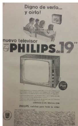
Figura 10 Anuncio de televisores Philips , 1966