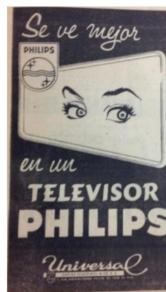
Figura 12 Anuncio de televisores Philips , 1960