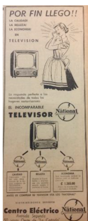
Figura 17 Anuncio de televisores National , 1960