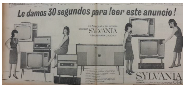
Figura 15 Anuncio de televisores Sylvania , 1966