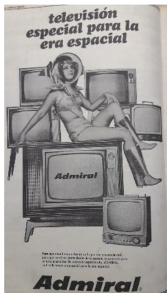
Figura 7 Anuncio de televisores Admiral , 1969