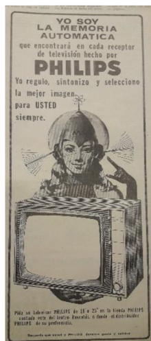
Figura 6 Anuncio de televisores Philips , 1968