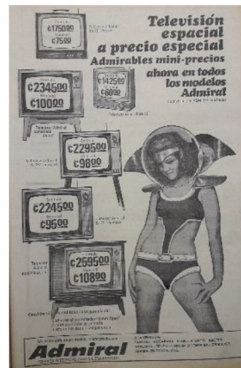
Figura 9 Anuncio de televisores Admiral , 1969