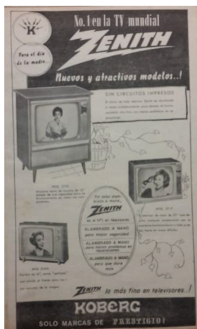
Figura 11 Anuncio de televisores Zenith , 1965