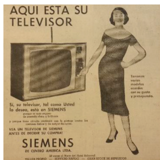
Figura 14 Anuncio de televisores Siemens , 1962