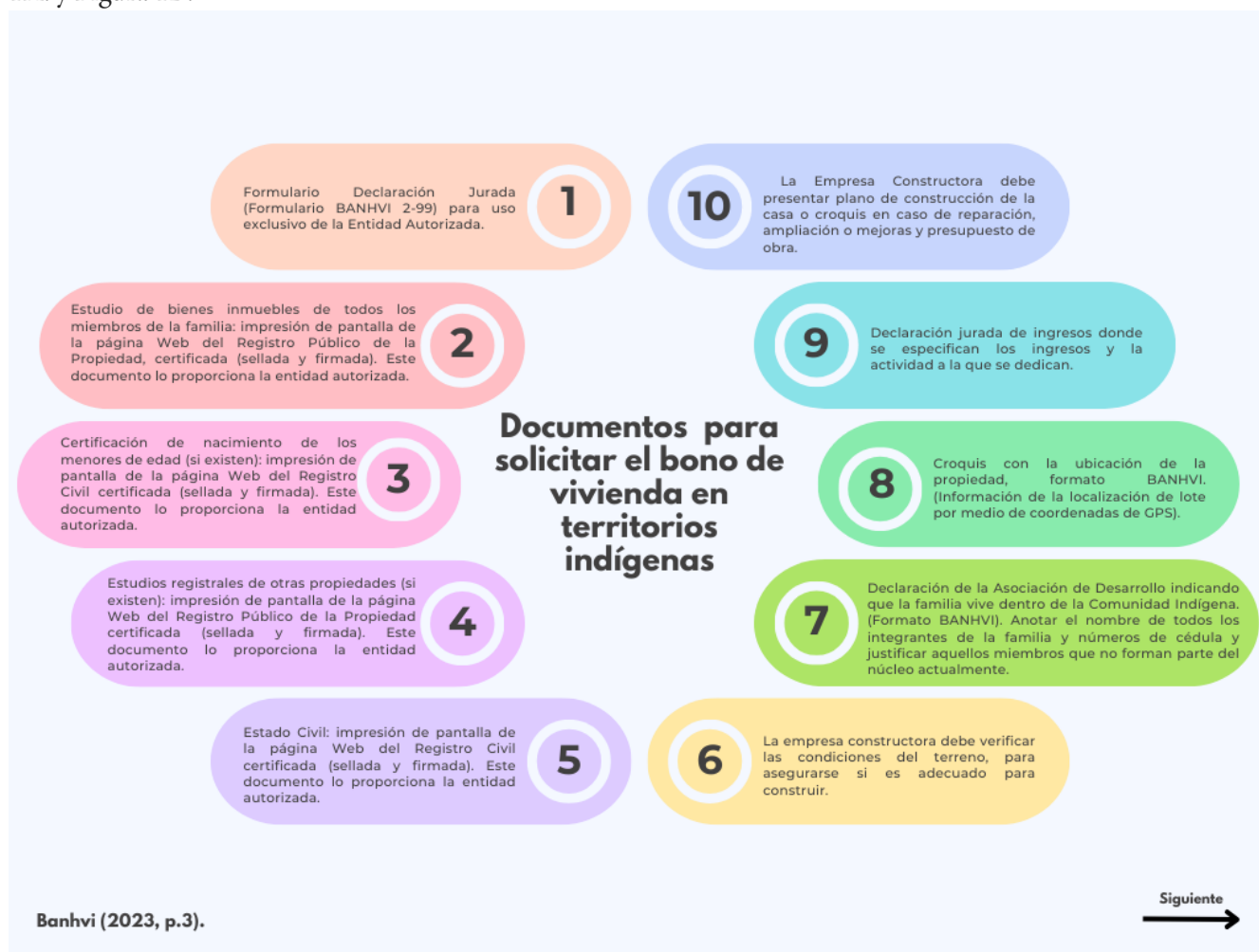
Figura 1A Documentos para solicitar el bono de vivienda en territorios indígenas. BANVHI (2023).

De acuerdo con Juan Figueroa, las personas que buscan obtener los bonos de vivienda indígena tienen la opción de expresar su preferencia por una empresa constructora específica a las ADII. Asimismo, es importante mencionar que muchas de las ADII ya cuentan con acuerdos y colaboraciones establecidas con diversas compañías constructoras (Figueroa, 2023, c.p.). Ahora bien, el BANVHI (2023) indica que los documentos necesarios para obtener el bono de vivienda en territorios indígenas se encuentran en las Figura 1A. y Figura 1B.