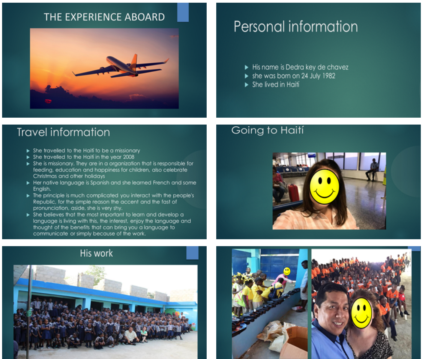
Fig. 2. Ejemplo de Presentación en lengua inglesa.

En la Figura 2 se recoge a modo de ejemplo una de las presentaciones realizada a partir de la entrevista a una inmigrante retornada que estuvo trabajando como misionera en Haití. Como se puede ver, en dicha presentación existen errores gramaticales cometidos por el estudiante. Estos errores y algunas otras dificultades de expresión y comunicación en lengua extranjera, fueron trabajados una vez finalizadas las jornadas – durante las presentaciones no se interrumpió a los estudiantes para hacer este tipo de correcciones –.