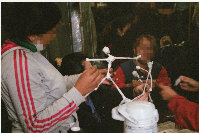
Figura 1. Trabajadores del centro de clasificación y acopio periférico, señalando los puntos de tensión y placer para determinar las exigencias del puesto clasificación de pie. Área Metropolitana de Buenos Aires, Argentina, 2015.