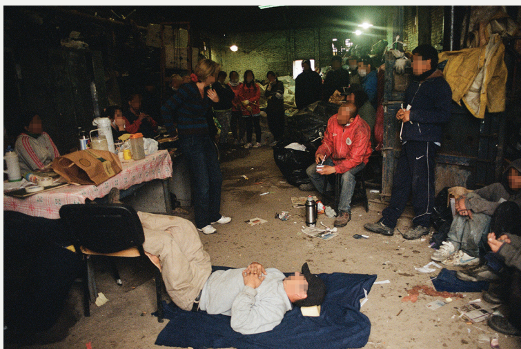
Figura 2. Trabajadores del centro de clasificación y acopio periférico realizando ejercicios de eutonía. Área Metropolitana de Buenos Aires, Argentina, 2015.