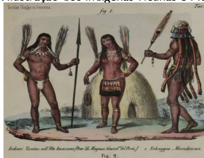
Figura 1: Ilustração dos indígenas Ticunas e Mundurucu

Nos cerca de quatorze meses de viagem, a exemplo do que fizera nas outras expedições, e a exemplo de outros viajantes, Gaetano Osculati reuniu um notável volume de amostras de animais, plantas, ornamentos, artefatos e outros objetos etnográficos dos lugares por onde passou, produziu notas e breves dicionários das línguas Quechua e Záparo, com termos e expressões destinadas a auxiliar os viajantes que porventura viessem a circular pela região e também a ajudar na navegação fluvial. Ou seja, além do relato da viagem, a obra contém os seguintes apêndices: Catálogo das armas, utensílios, ornamentos, instrumentos de caça e pesca de várias tribos, que compõem a coleção etnográfica do autor; notas sobre a língua Zaparo (pequeno dicionário e algumas frases necessárias para os viajantes); pequeno dicionário da língua Quechua com frases e vocábulos necessários para a navegação no rio Napo; sinopse dos vertebrados doados ao Museu de Milão; notas bibliográficas comentadas sobre as principais obras sobre a região do Rio Amazonas e seus afluentes; mapas e ilustrações das regiões percorridas em que transparecem paisagens e povos que iam sendo conhecidos. Para além do relato da viagem, a edição constitui-se, portanto, uma importante fonte de pesquisa para compreender uma parte da história da América, feitas as ressalvas referentes ao “filtro” europeu ao criar essas imagens. É o caso das ilustrações que reportamos a seguir, a título de exemplo: