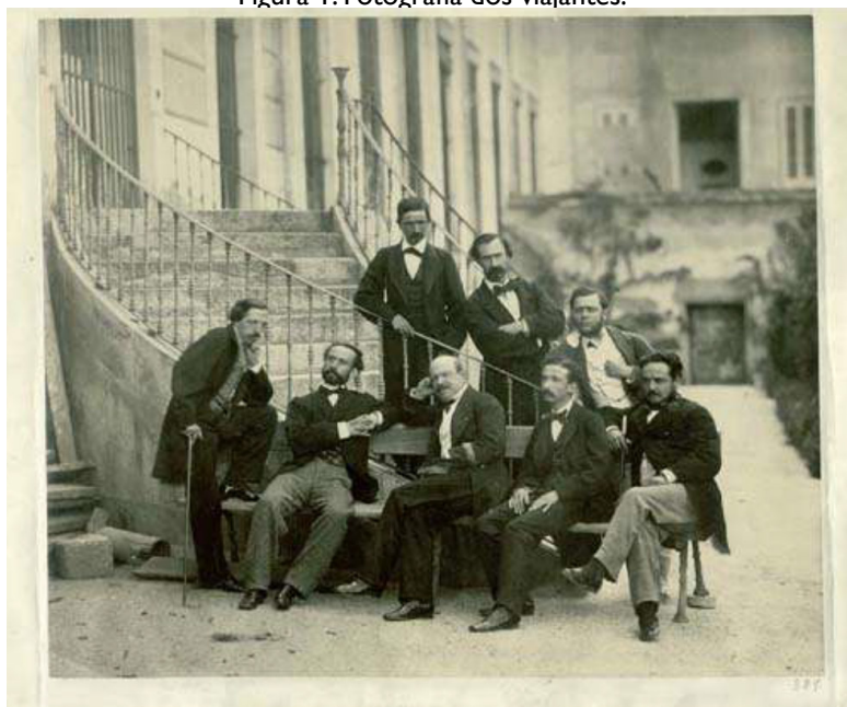
Figura 1: Fotografia dos viajantes.

1