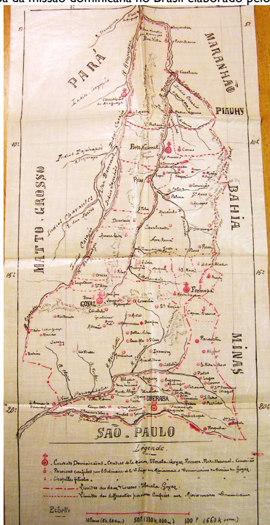
Figura 1: Mapa da missão dominicana no Brasil elaborado pelos missionários