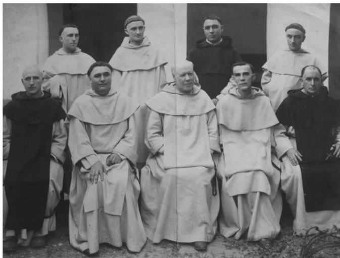
Figura 3: Padre Gallais (ao centro) em uma de suas visitas canônicas ao Brasil

Fonte: Arquivos dominicanos de Toulouse in: PIC, Claire: Les dominicains de Toulouse au Brésil (1881-1952): de la mission à l’apostolat intellectuel. Université de Toulouse le Mirail, 2015.