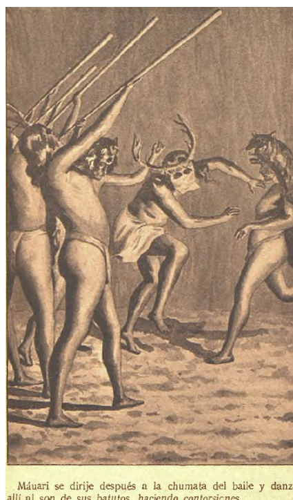
Figura 4: Máuari dançando

Máuari se dirige después a la chumata del baile y danza allí al son de sus batutos, haciendo contorsiones..