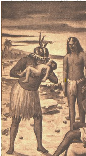
Figura 2: Piache retirando maus espíritos da criança

Assim, dentre os capítulos traduzidos, a primeira imagem aparece no Capítulo II (figura 2) e pode ser vista a seguir: