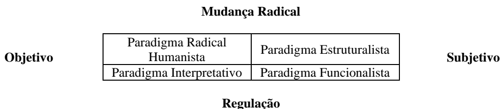
Figura 1 – Paradigmas Epistemológicos.

Em seu desenvolvimento, essas duas dimensões foram combinadas e abriram quatro paradigmas da ciência social, conforme ilustrado na Figura 1, extraída de Rodrigues Filho (1998).