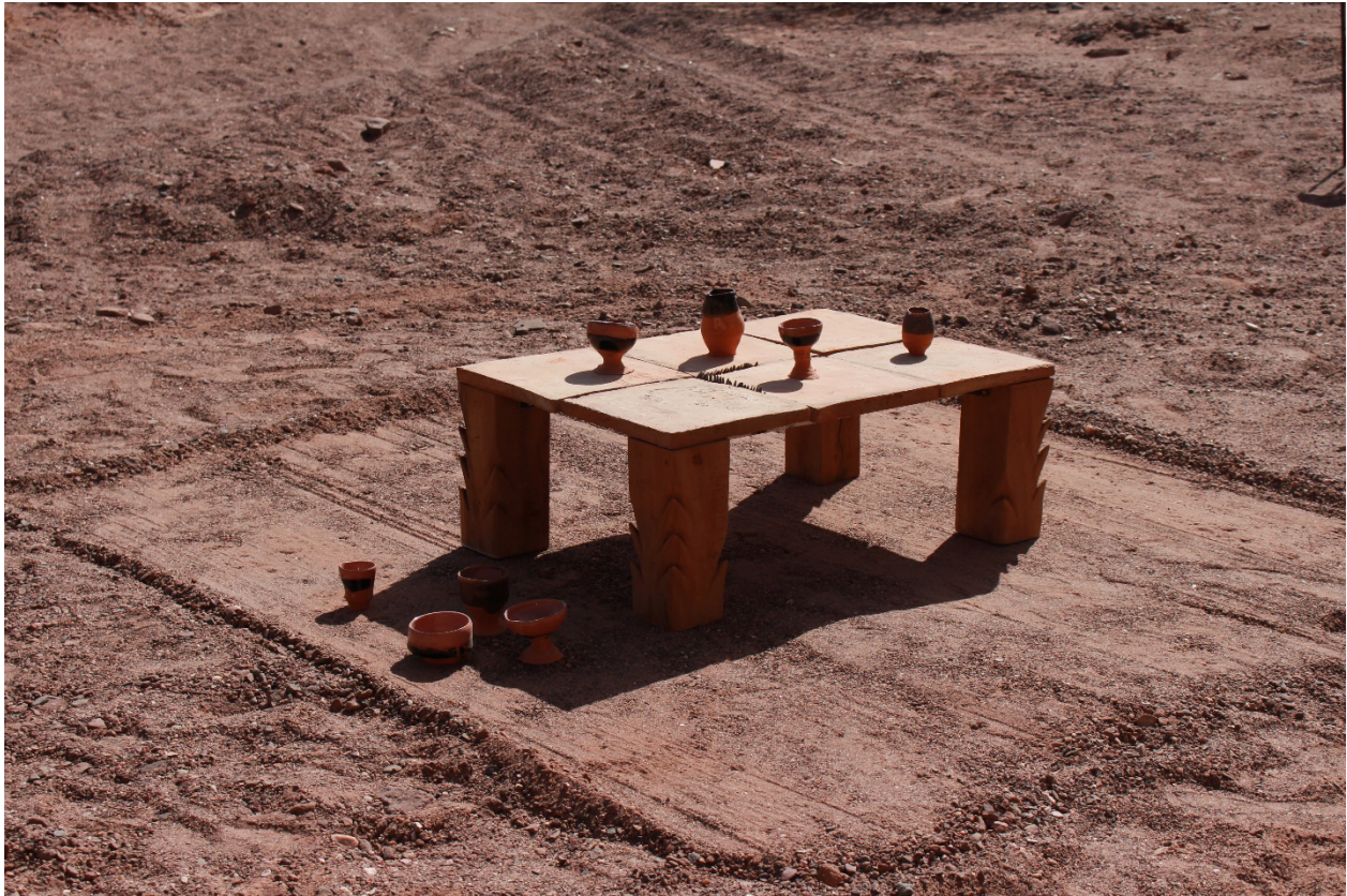
Imagen 8. Florencia Sadir y Ángeles Rodríguez. Geografía de la imaginación . 2020. Instalación. Algarrobo, tejas de barro cocido. 120 x 100 x 60 cm. San Carlos, Salta