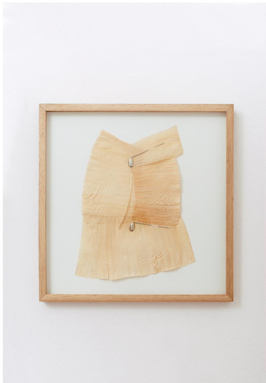
Imagen 1. Florencia Sadir, S/T 2022. Chalas de maíz y alpaca. 40x40cm