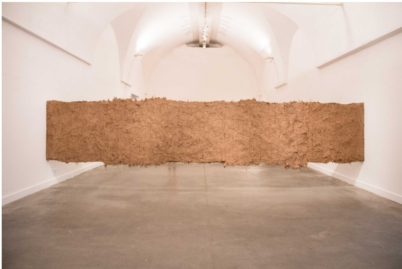
Imagen 4. Un lugar sin nombre . 2018. Instalación de quincha suspendida (barro y paja). 500 x 100 cm. Centro Cultural Recoleta, Buenos Aires, Argentina