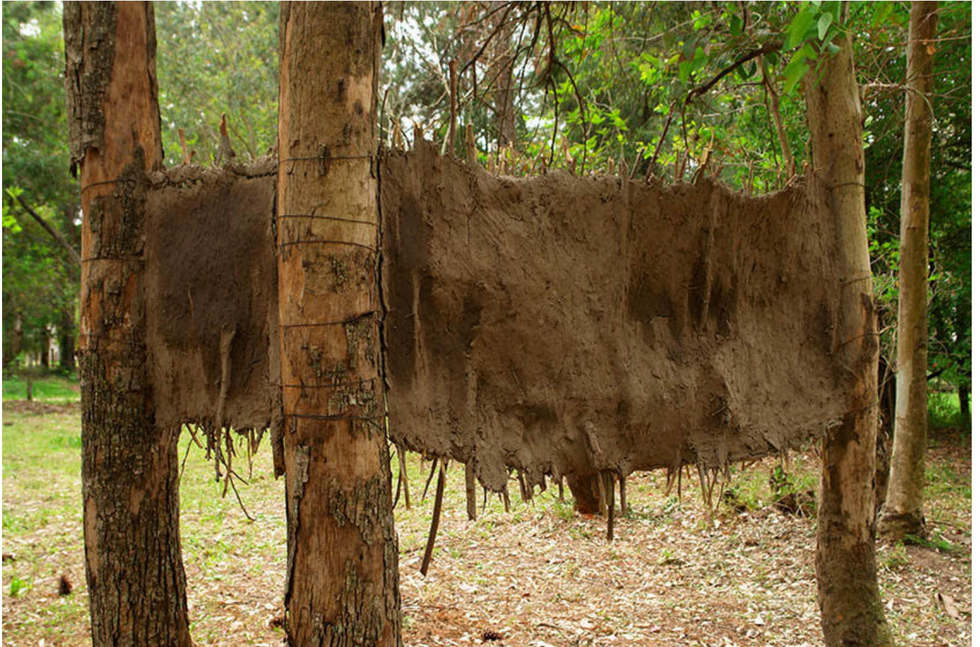
Imagen 3. S/T. 2016 Quincha de barro y paja entre los árboles 240 x 70 cm. Curadora Residencia. Santa Fe, Argentina