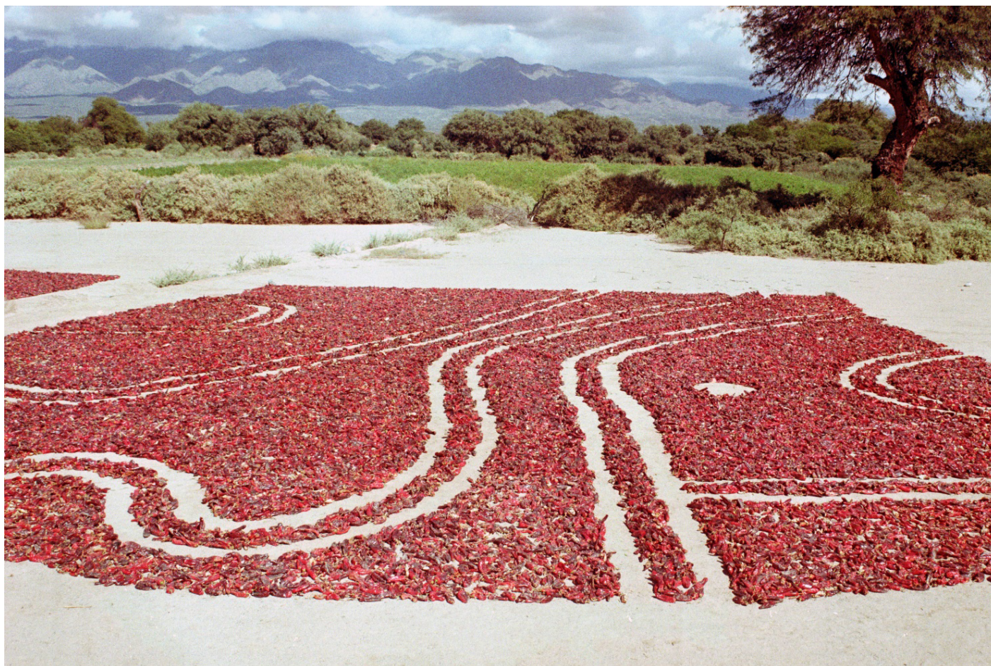
Imagen 9. Florencia Sadir, Caminar sobre lo rojo . 2021 Dibujos sobre pimientos. San Carlos, Salta