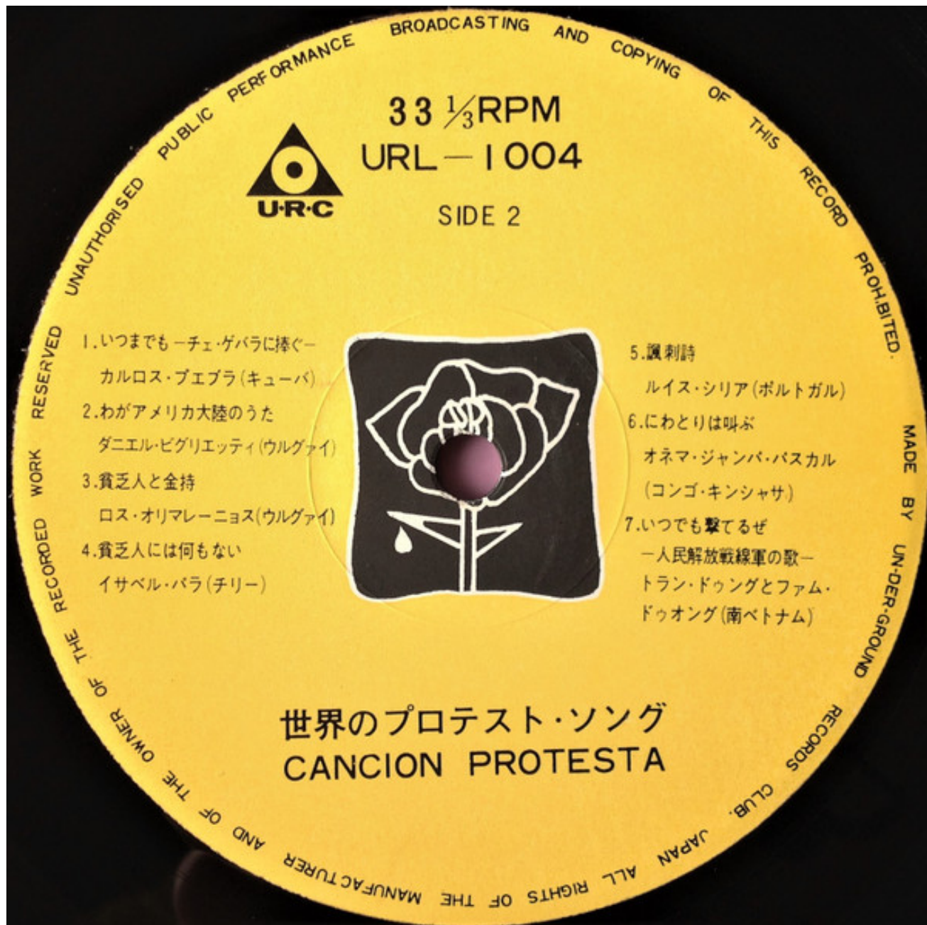
Imagen 3. Disco Canción Protesta

Fuente: Canción Protesta. Tokyo: URC, 1969. URL-1004