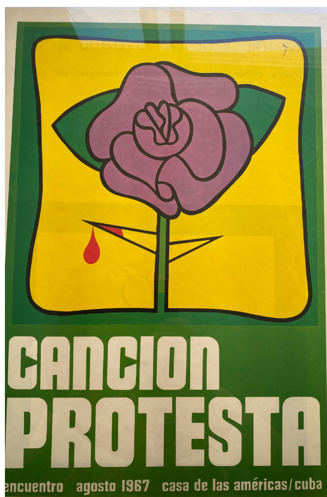
Imagen 1. Alfredo Rostgaard, “Canción Protesta,” póster del Encuentro de la Canción Protesta

editados por los músicos que participaron en el encuentro.