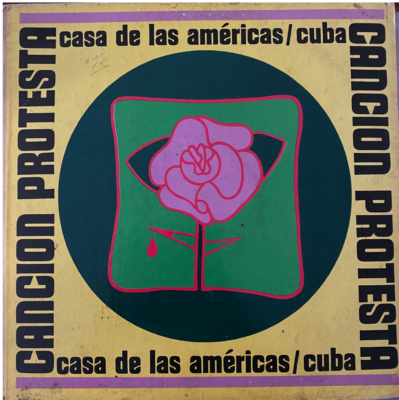
Imagen 2. Portada del LP Encuentro de la canción protesta