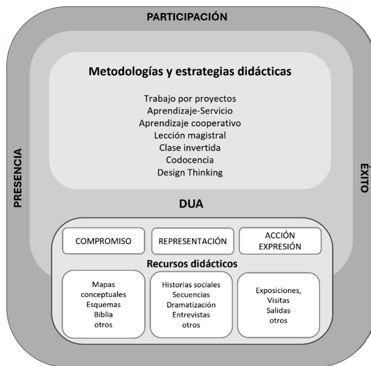
Figura 2. Principios de la propuesta didáctica

ción a las diferencias en el aula y se favorecen los principios básicos de la inclusión: presencia, participación y éxito (Booth y Ainscow, 2015) (Figura 2). El enfoque global, el desarrollo integral y la interdisciplinariedad precisan, en la enseñanza de la religión y de todas las materias, un ajuste a las características del alumnado (Escorcia, 2021).