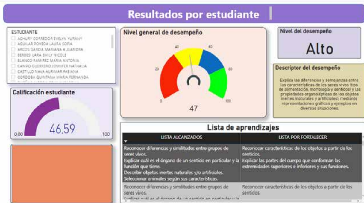
Figura 1. Tablero de control para la presentación de resultados de aprendizajes.

en relación con la gestión de los instrumentos de la evaluación, es necesario garantizar no solo la administración de las notas (software), sino el desarrollo de tableros que gestionen atributos mixtos (cualitativos y cuantitativos) como resultado de la aplicación de los instrumentos, los cuales se pueden derivar de los parámetros definidos en el punto anterior. Por ende, es necesario establecer los puntos de corte para los niveles de desempeño o dominio (revisar standard setting), si la evaluación es por competencias. Se recomienda la implementación de estos tableros haciendo uso de herramientas como Power BI de Microsoft o Tableau (figura 1).