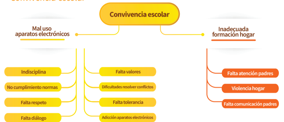
Gráfica 1. Convivencia escolar

Nota. Se muestra el análisis de la convivencia escolar desde el Atlas-ti Scientific Software Development GmbH (Versión 7.5.18.2023).