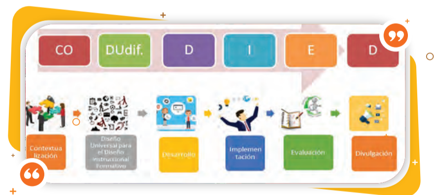
Figura 3. Diseño instruccional CODUDIED

Nota: La figura muestra el diseño instruccional CODUDIED (contextualización, dualización del diseño, desarrollo implementación, evaluación y divulgación)