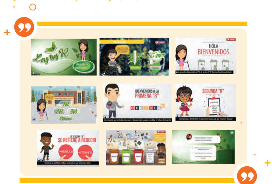
Figura 4. Objeto Virtual de Aprendizaje (OVA) “Las tres R”

Nota: La figura pone a la vista la interfaz del Objeto Virtual de Aprendizaje (OVA) “Las tres R” que consta de seis sliders interactivos conducentes a la consecución del objetivo académico.