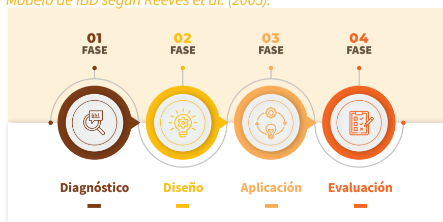
Figura 1. Modelo de IBD según Reeves et al. (2005).

Nota: La figura representa la secuencia de las fases del Modelo de IBD propuesto por Reeves et al. (2005).