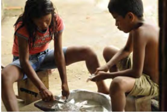
Fotografia de Lucie Robieux.