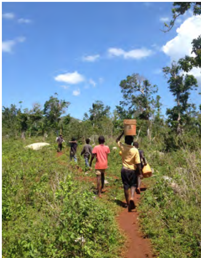
Foto 2. A volta para casa depois de uma tarde de trabalho

A transmissão dos saberes opera-se dos mais aos menos experientes: de menino a menino, de jovens e adultos aos meninos, de adultos conhecedores do mundo das pedreiras aos jovens. A relação de transmissão entre parceiros ( partnè ) é, sem dúvida, a mais importante para aquisição dos saberes necessários à quebra, à triagem, ao transporte e à venda da areia.