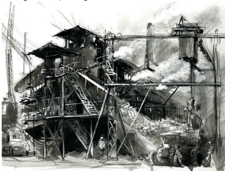
Imagen 4. Dibujo del ingenio de caña de azúcar El Atirro, Turrialba