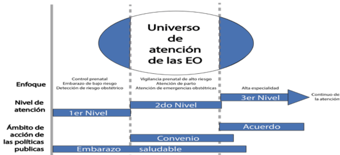
Figura 2. Atención de las emergencias obstétricas en México