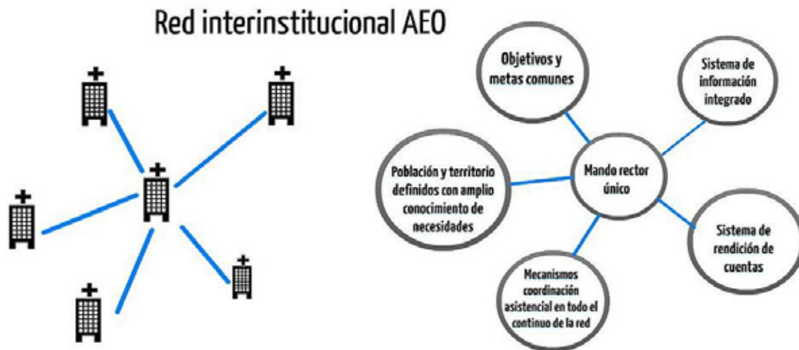
Figura 1. Propuesta de red para la AEO