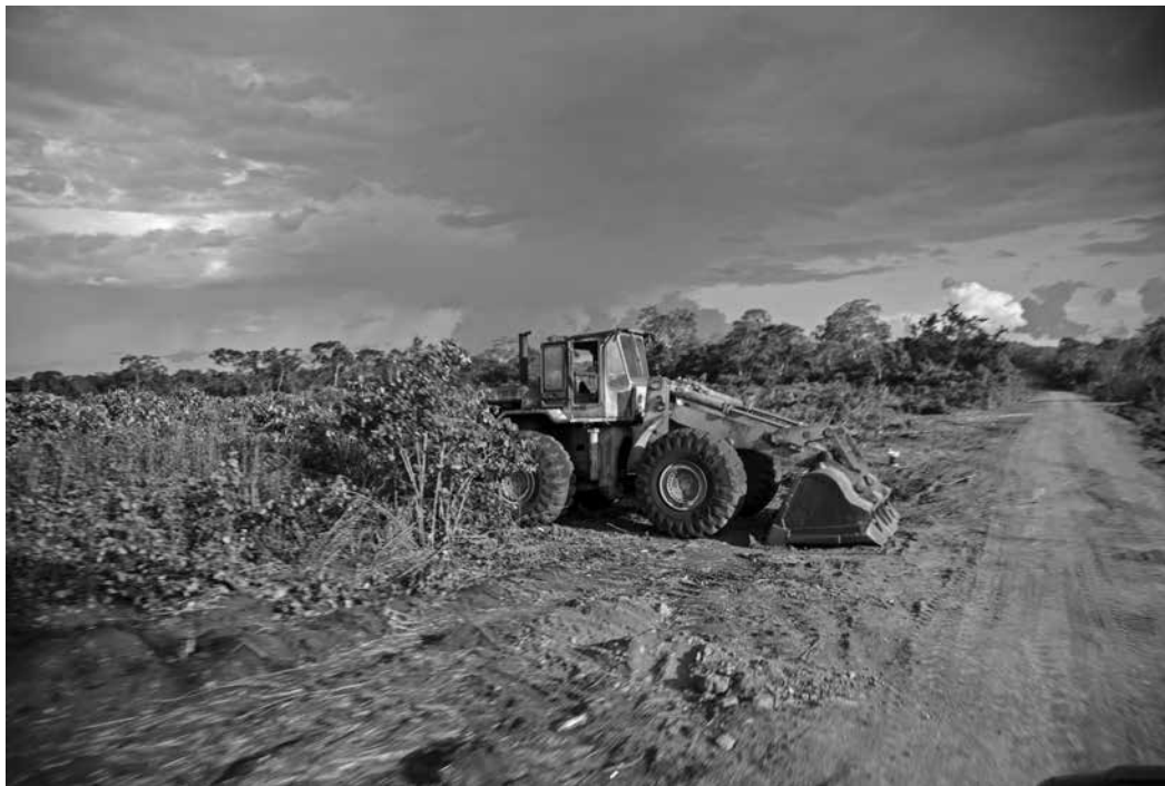
Foto 1. Deforestación