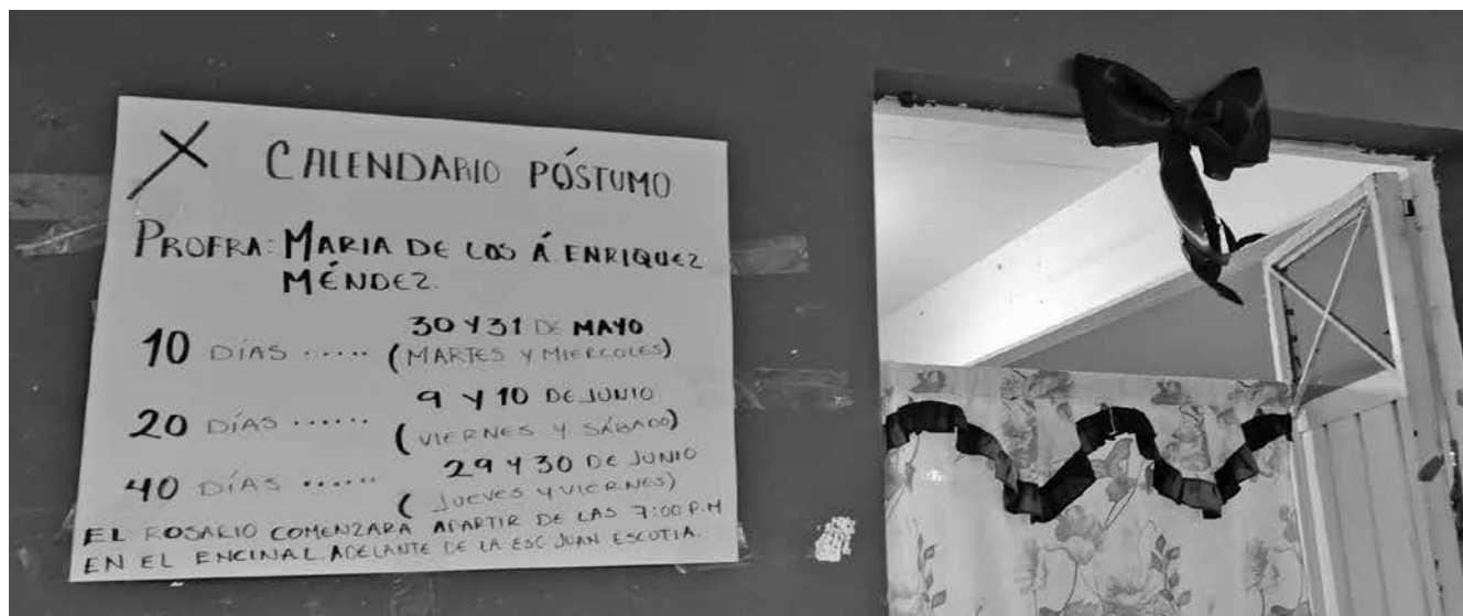
Calendario póstumo

poseer el difunto, es un ritual de purificación y lo hacen frente a la cruz y frente a los asistentes (foto 2).