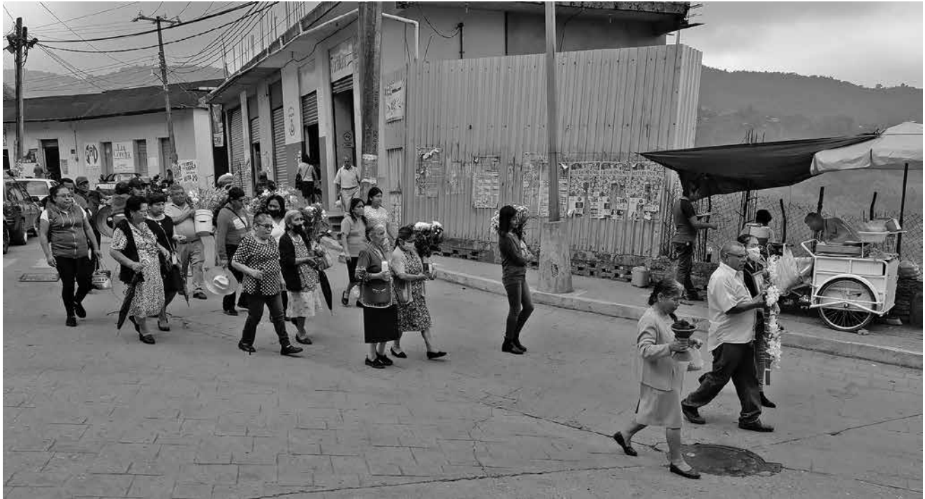
Llevando la cruz a los 40 días. Foto: Raitamaria Mäki, 2023.

misas ya se podían hacer con un cupo limitado y sin el cuerpo presente, con la foto de la persona fallecida.