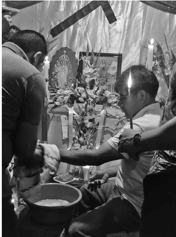
Ritual de lavado de manos a los padrinos de cruz.

151). En ese momento, la gente se alarmó, pero aún había quienes no creían o no acataban las medidas preventivas, como el uso de cubrebocas.