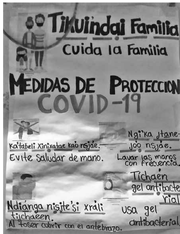
Medidas de protección sanitaria en lengua mazateca y en español. Foto: Fabiola Minero Ortega, 2021.

ron del virus, parecidos a las zarzamoras espinosas. Se le dedicó una canción en mazateco al virus como parte de las festividades de Todos Santos en 2020. Las personas con síntomas leves de SARS-CoV-2, parecidos a la gripa común, se atendieron con medicina tradicional: aguardiente con hoja de zorrillo, baños de camote amargo y tés de ajo, canela, miel como dijo la curandera Florencia.