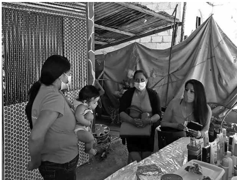
Mujeres trabajando durante la pandemia.