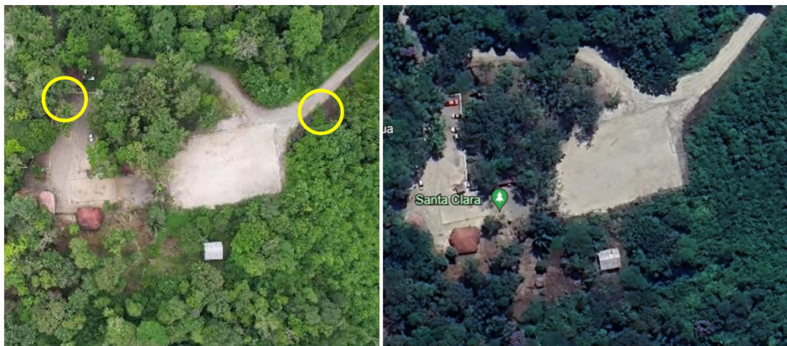
Figura 2. Fotografías del balneario en dos diferentes momentos: (a) capturada por un dron en el 2024; (b) tomada de Google heart 2023