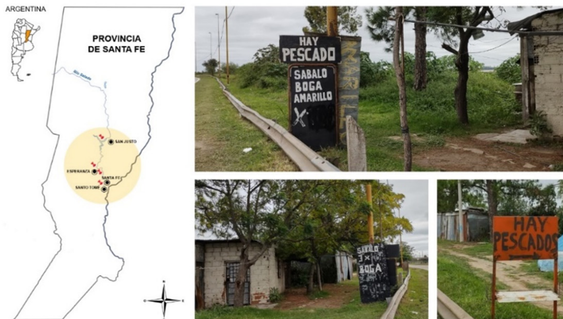
Fig. 1: Mapa de sitios de muestreo y puestos de ventas de pescadores artesanales de las zonas ribereñas de Santa Fe.