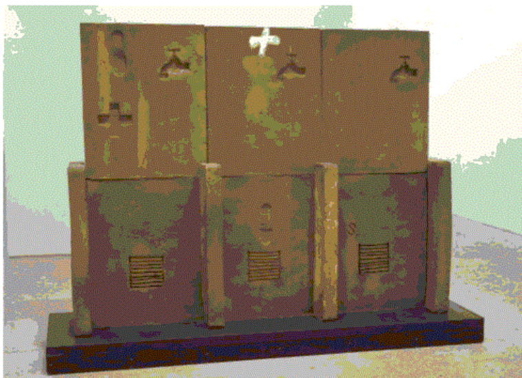
Imagen 2. Muro, de Antoni Tàpies (1991)