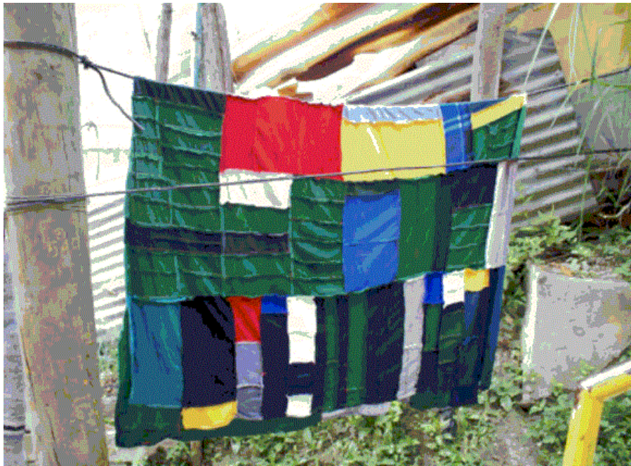
Imagen 4. La añorada cocha de retazos, de Carlos Múnera (2009)

La trama no es un proyecto sino un trayecto, no es una trayectoria proyectada sobre un plano, sino una transcripción y una huella. Una deriva que, unas veces, describirá ingenua y trivialmente cualquier tema por medio de un lenguaje más o menos ordinario, y otras, narrará de manera silenciosa intimidades de alguna lengua y alguna casa. La táctica, como un arte del débil (De Certeau, 2000), no es tanto una trayectoria cuanto una trama y una retórica que se entretije de las trivialidades y las artimañas –ambos correlatos de las resistencias– propias de lo cotidiano. Semejante trama se resiste a la publicidad y a las falacias de la privacidad que han confundido y echado a perder nuestra intimidad. “La narración íntima, el cuento vivido, el espacio celebrado, ritmado, cantado, no es lo que hay dentro (en ese interior opaco y jurídicamente protegido) del espacio privado, porque la intimidad está fuera del espacio público y del privado” (Pardo, 1996: 252).