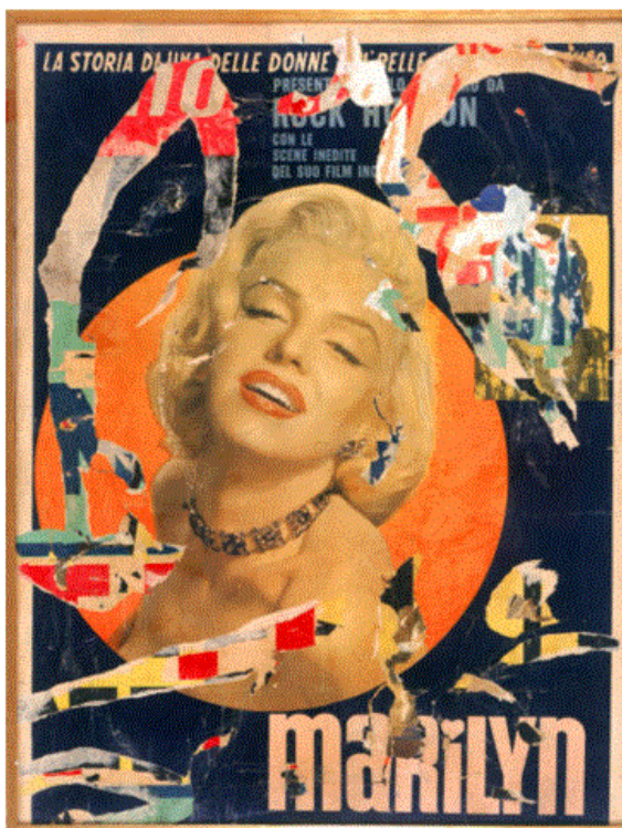
Imagen 1. Marilyn, de Mimmo Rotella (1963)

manera rezagado–, como lo anunciara Arthur Danto (1995) en El fin del arte. 4