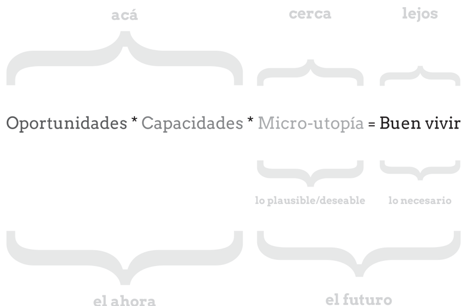
Figura 4. Temporalidad de la fórmula

practicante va a cocrear visiones de cómo podrían ser las cosas en el camino hacia el BV. Si bien, el BV es un futuro necesario, está muy lejos. Hay una sensación de su imposibilidad en el ahora, sin embargo, las microutopías están más cerca, emergen de las posibilidades del ahora, pero se arriesgan a imaginar un cambio sistémico (Figura 4).