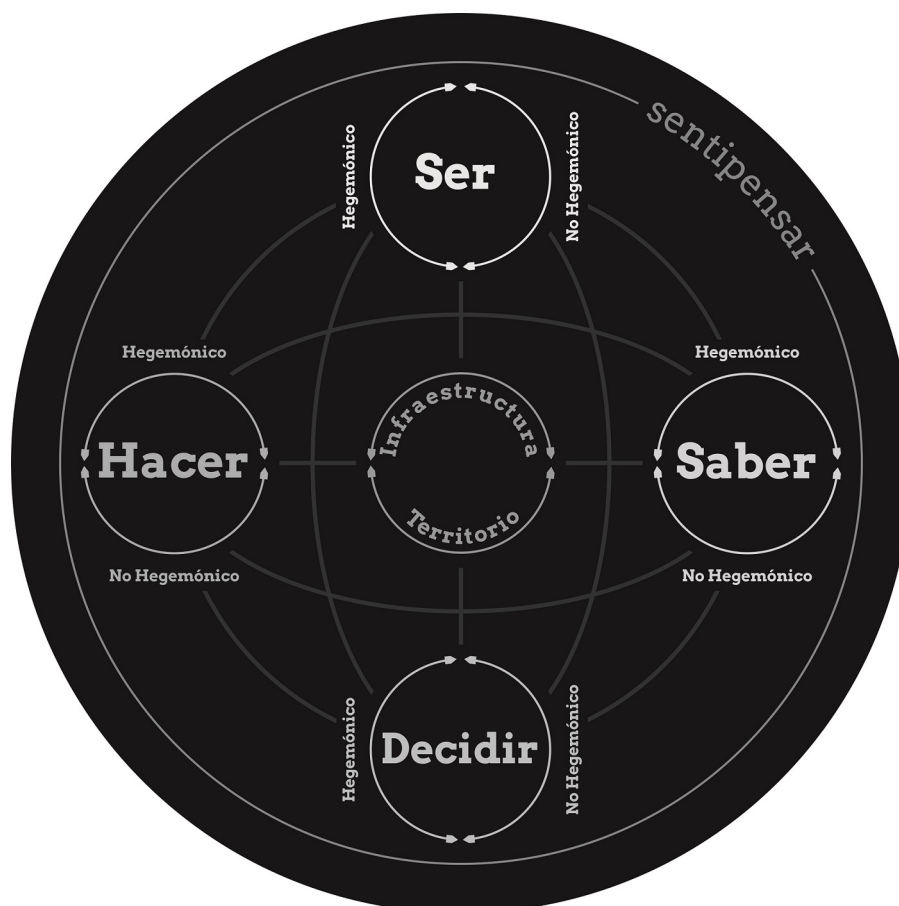
Figura 2. Chakana territorial

Para Moraes y de la Torre (2002), la interacción lingüística es una expresión del sentipensar modulada por las emociones resultantes de la convivencia diaria de una comunidad. Haciendo referencia a la obra de Humberto Maturana, los autores proponen la conversación como la convergencia del flujo de emociones con el lenguaje. Esto es de especial importancia para los practicantes, ya que es a través de la conversación con diversos actores que el proceso avanza. La detección de oportunidades y capacidades, la ideación de vías de cambio y la movilización de estrategias necesarias para implementar la transformación emergen de los diálogos entre múltiples actores. Dichas conversaciones son dinámicas, relacionales y buscan crear conexiones constantes entre personas, ideas y variables diversas. Los problemas perversos son la preocupación principal de la práctica transformadora, por lo tanto, se hace necesario un enfoque sistémico, holístico y articulado desde el sentipensar.