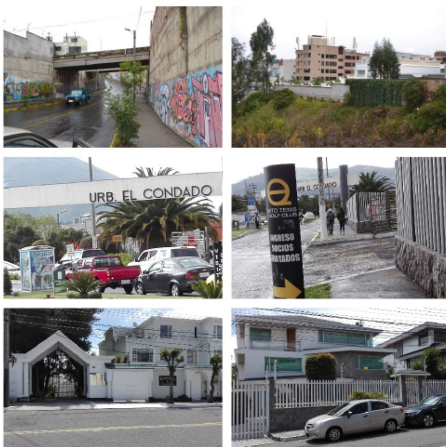
Figura 2. Elementos del entorno construido de la Urbanización el Condado

Se indicó que algunos procesos históricos han configurado fronteras urbanísticas principalmente en la Urbanización. Estos elementos han causado la aparición de distintos filtros de distanciamiento, provenientes del entorno construido donde residen los estratos altos. En concreto, se identifican cuatro filtros. El cerramiento perimetral de la urbanización es el primero; la guardianía ubicada en sus ingresos es el segundo; los cerramientos personales de las viviendas, el tercero. El cuarto lo origina el personal de vigilancia de cada vivienda. Todos ellos se robustecen con las rondas motorizadas de vigilancia que realiza la guardianía del conjunto (Figura 2).