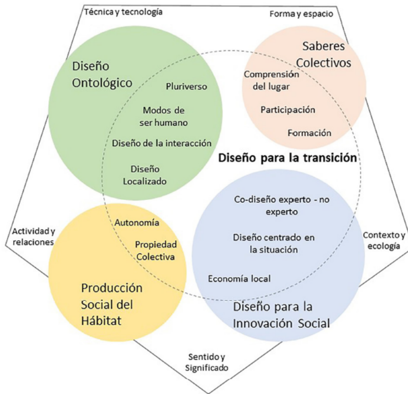
Figura 4. Aportes al diseño para la transición desde algunas prácticas de diseño relacionadas

reduciendo el riesgo de abandono de estos en fases intermedias o la percepción de no propiedad de los espacios construidos por entidades ajenas al territorio.