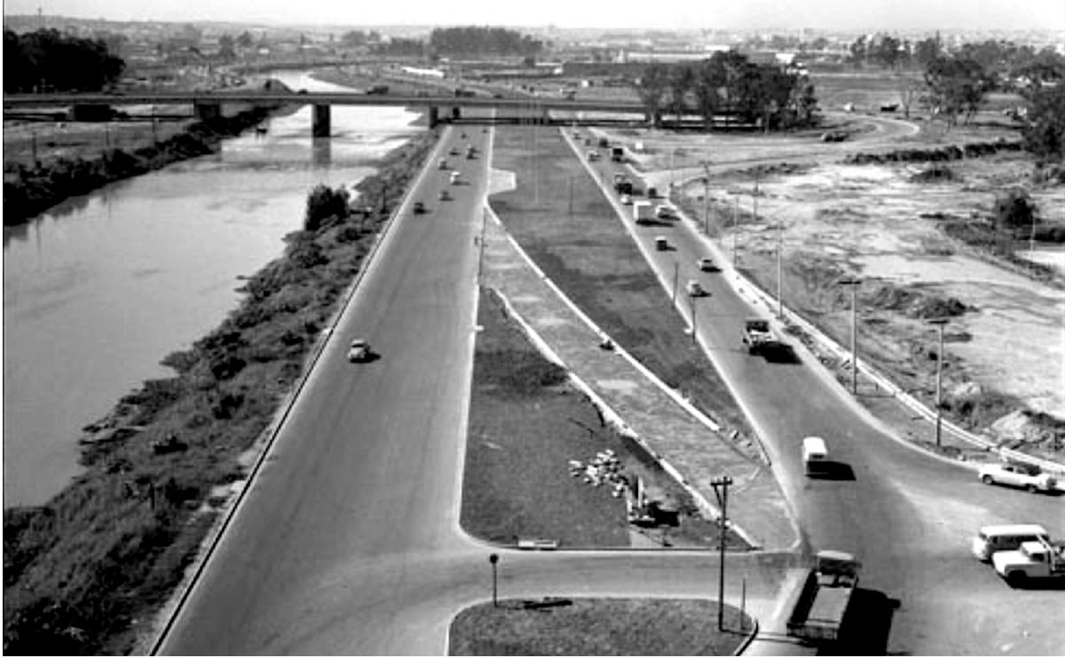
Figura 1. Marginal Tietê, em São Paulo, ano de 1969