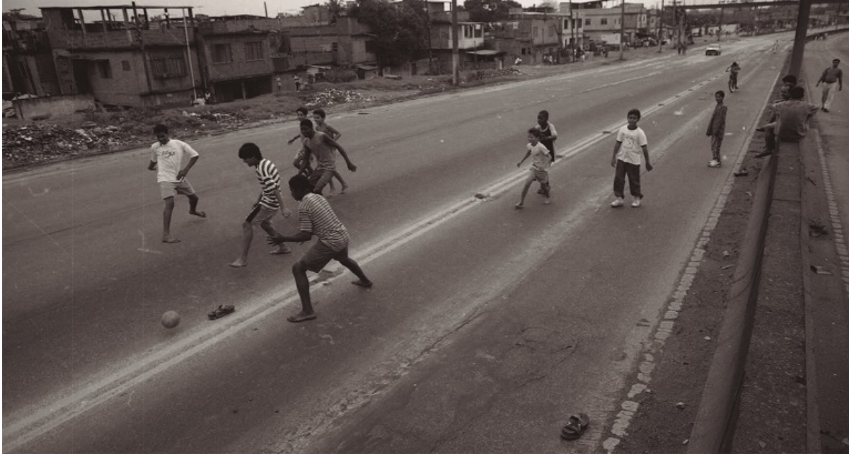
Figura 4. Crianças jogam nas pistas interdidas da Avenida Brasil, 1993