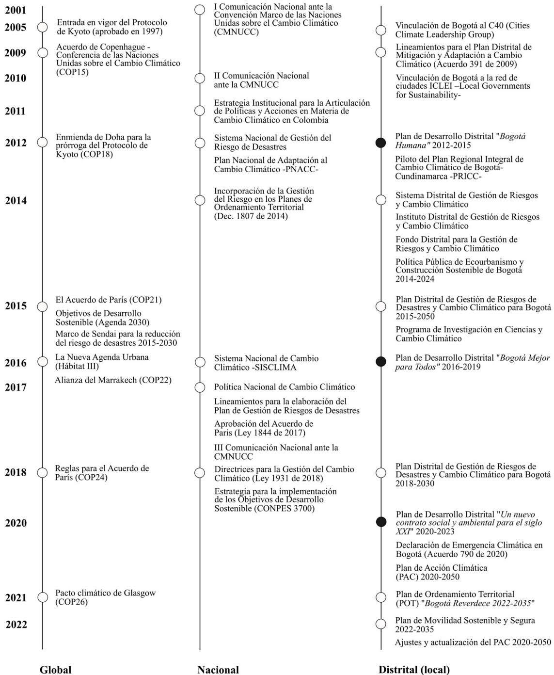
Figura 1. Línea de tiempo de la planificación climática en Bogotá

Además de los lineamientos definidos desde el nivel nacional, la política climática de Bogotá ha tenido una trayectoria propia, en donde la cooperación internacional y el multilateralismo han resultado determinantes, al igual que en otros contextos (Castán Broto, 2017; Heikkinen et al., 2020 y Hughes et al., 2018). En 2011