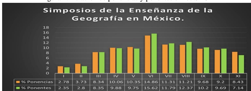
Figura 1. Relación de ponencias y ponentes en los SEGM

Elaboración propia con base en las memorias de los SEGM 1982-2019.