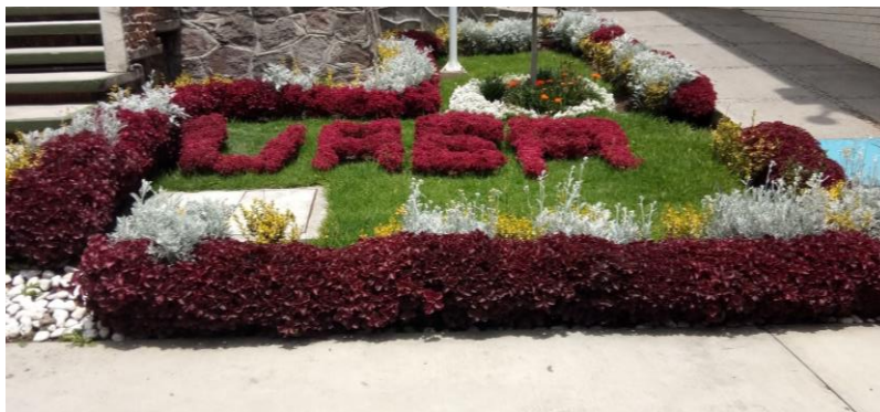
Jardinera Facultad de Odontología