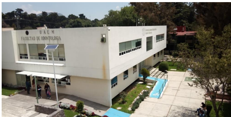
Facultad de Odontología

Los estudiantes al caminar por los pasillos de la facultad observan en los muros placas alusivas al título de esta crónica, las cuales les darán la pauta de su compromiso con la sociedad, al ser integrantes y futuros profesionistas del ramo.