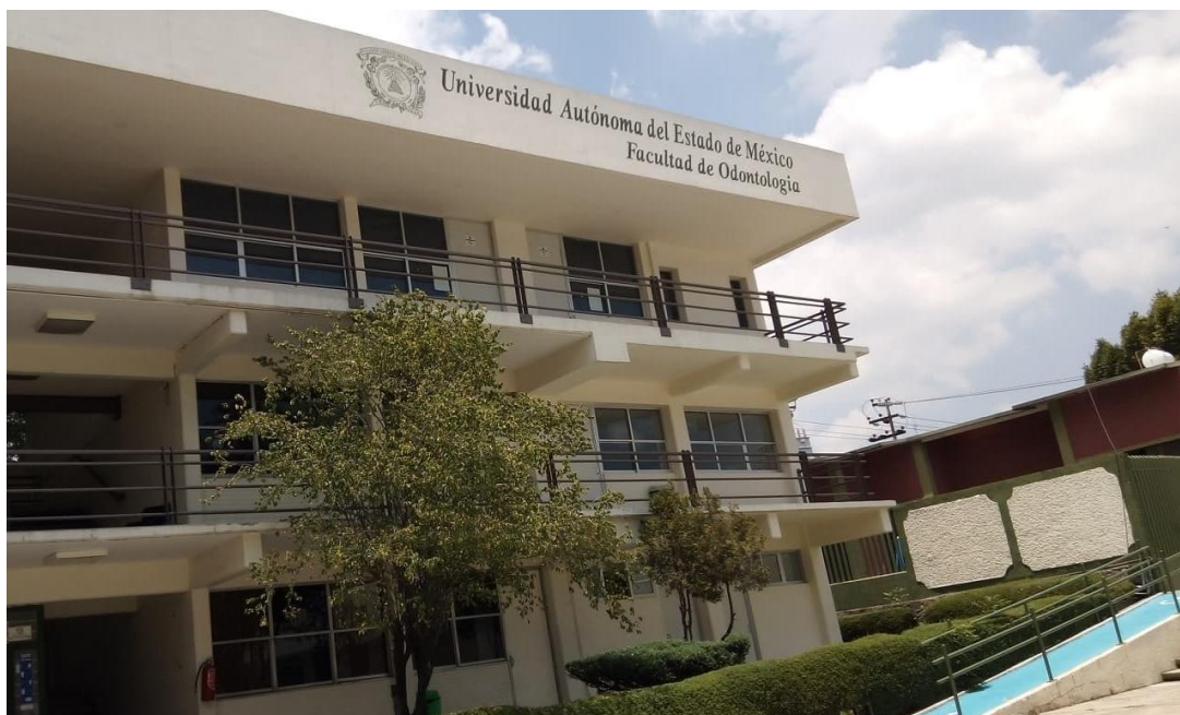
Facultad de Odontología