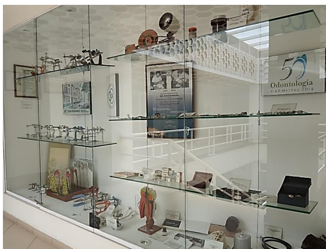
Museo odontológico Facultad de Odontología

Los problemas y necesidades dentales, siempre han existido desde tiempos ancestrales. La educación y habilitación de los personajes que a la dentistería se dedicaban, eran producto de su propia iniciativa o herencia, su audacia y de sus enseñanzas a través de sus propios errores o de la observación y experiencia. Posteriores a esas épocas, eran los médicos quienes se responsabilizaban de la atención bucal. El Dr. Pierre Fauchard, nació en Bretaña en 1678, cirujano militar que ejerció en París a partir del año de 1719, estableció a la Odontología como una verdadera profesión.