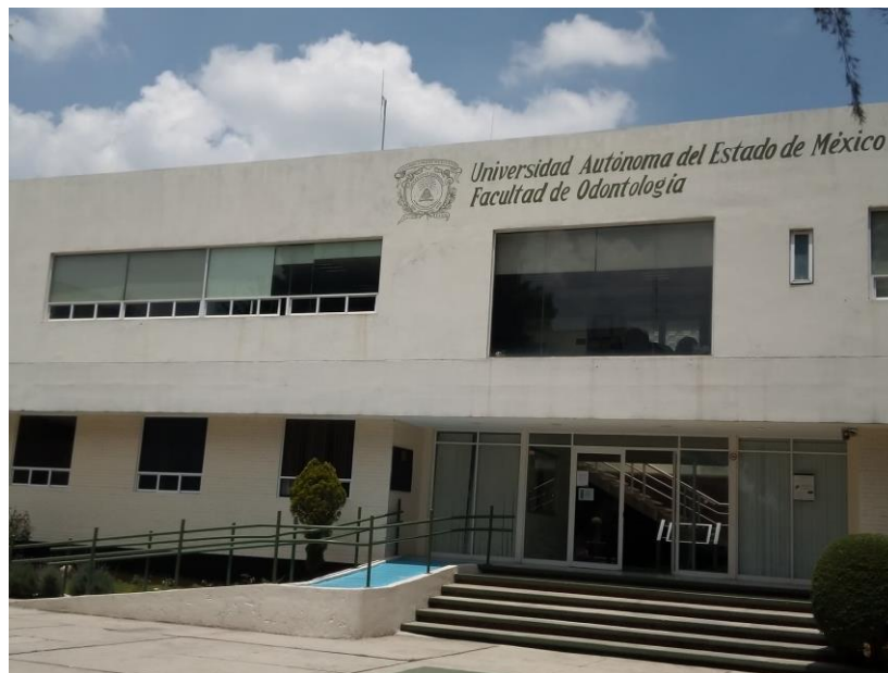
Facultad de Odontología