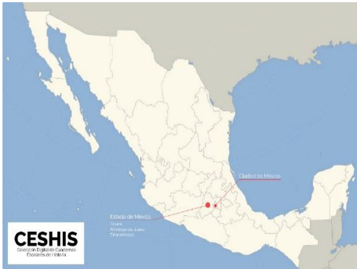
Figura 1. Estados de origen de los cuadernos escolares.

En el siguiente mapa se señala el origen de los cuadernos escolares recuperados en esta plataforma: Mapa de referencia de origen de los cuadernos escolares. (México país, Edo. de México y Ciudad de México) (Figura 1).