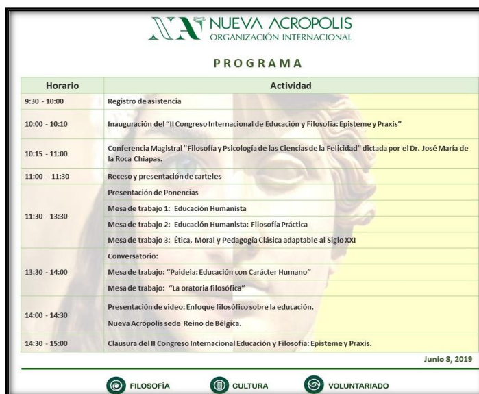
Figura 2. Programa de II Congreso Internacional de Educación y Filosofía: Episteme y praxis.

Las actividades del Cuerpo Académico como proyecto estratégico, se determina obtener productos de orden académico con la participación en diferentes eventos que constituyen una evidencia del trabajo colaborativo de sus integrantes a través de la docencia, investigación, vinculación y divulgación, que a partir su misión es: realizar investigación educativa que promueva la transformación innovadora de la educación, desde una perspectiva humanista del “ser” que como docente se asume como el hombre, ante la responsabilidad del mismo hombre.