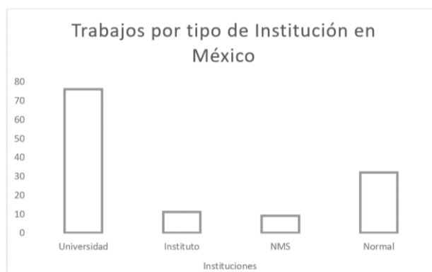
Figura 2. Número de trabajos por tipo de institución en México.

Resulta interesante analizar el tipo de institución desde la cual se realizaron las investigaciones que se presentaron el II CIIE, lo cual se representa en el siguiente gráfico.