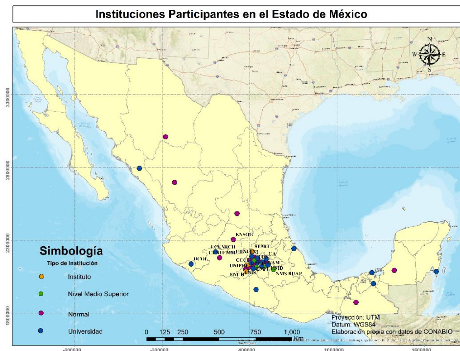
Figura 4. Mapa de instituciones participantes en el II CIIE 2018.