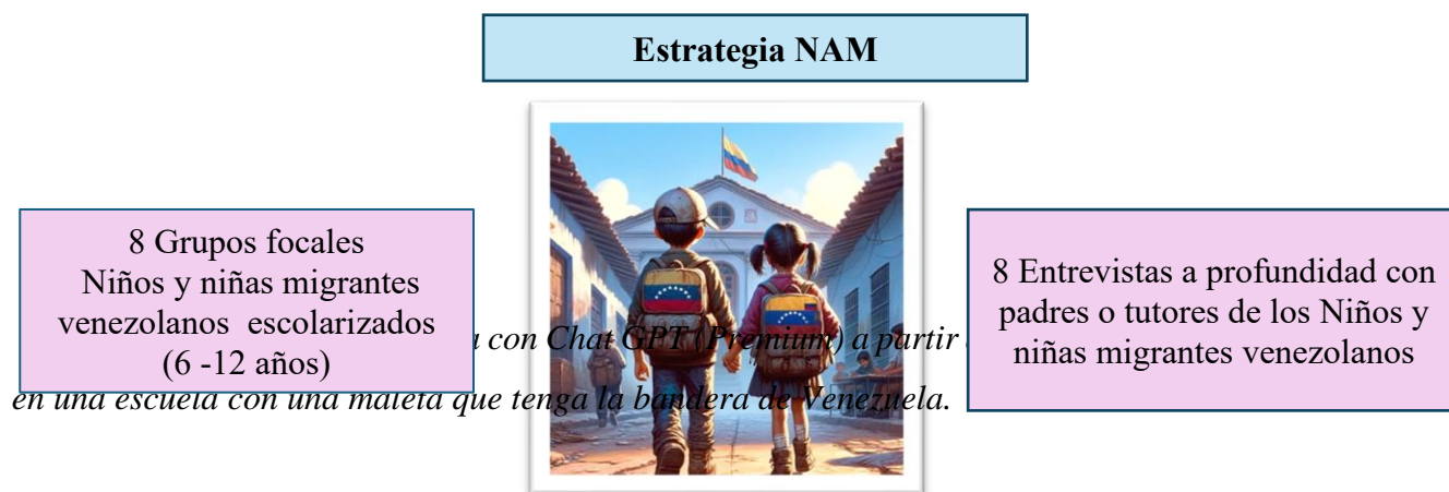
Figura 2: Participantes de la investigación

A continuación, se relaciona la población que participó de la estrategia NAM y que aportó su voz en la investigación: